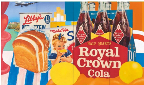
تصویر ۲. تام وسلمن، طبیعت بی‌جان، 1963.

ادوارد لوسی اسمیت ۱۳ در مورد فراگیری پاپ عقیده دارد عواملی که منجر به هنر پاپ شد به هیچ‌وجه جهانی نبوده و بیشتر با فرهنگ جامعه آمریکایی و تاحدی انگلیسی در سال‌های پس از جنگ سازگار بودند. لذا تنها هنرمندانی که با این فرهنگ مانوس بودند زبان بیانی آن را دریافتند. بدین ترتیب بسیاری از هنرمندانی که خارج از این حوزه جغرافیایی بودند، هنرمندان حقیقی پاپ نیستند. حتی هنرشان به هیچ‌وجه به شدت پاپ آمریکایی و انگلیسی نبوده و حرکت‌هایی نسبتاً مستقل از جامعه قلمداد