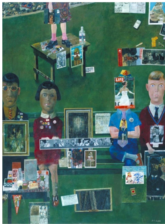
تصویر ۱. پیتر بلیک، در بالکن، 1955-7.

هنرمندان پاپ‌آرت با فاصله گرفتن نگرشی عاطفی به جهان، جهت‌گیری به‌سمت جوانی و لذت‌گرایی، احترامی شوخی‌آمیز نسبت به همه چیز و نگاهی بدبینانه به جهان اتخاذ کردند. چنین نگرشی به آن‌ها اجازه می‌داد تا در مورد وعده‌های دروغین نظام سرمایه‌داری و مصرف‌گرایی انبوه (بطری کوکاکولا، فست فود، سوپرستار هالیوود و غیره) اظهار نظر کنایه‌آمیزی داشته باشند (Shanes, 2002: 24). بدین ترتیب، پاپ‌آرت صرفاً بازتابی در مورد تبدیل جامعه معاصر به منظره (نمایش) نبود، بلکه هم فرهنگ