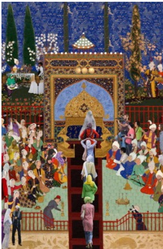
تصویر ۱۰. سودی شریفی، ۱۳۹۰، هفته مد، مجموعه ماکسیاتور، منبع: (URL 9)