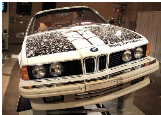
تصویر ۴. رابرت راوشنبرگ، نقاشی روی ماشین، ۱۹۸۶.