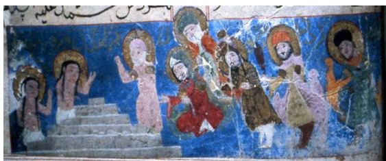
تصویر ۸. از گوربرخاسته: پیامبر و اصحاب بر گور ورقه و گلشاه در حالی که دوباره زنده شده‌اند، مکتب سلجوقی، پیامبر با محاسن سفید و لباسی روشن‌تر از دیگران متمایز شده است؛ هنرمند اینگونه شخصیت والای معنوی محمد (ص) را به تصویر کشیده است. منبع: (URL)

نظامی گنجوی شاعر قرن ششم و دوره سلجوقی نیز چنین می‌سراید: ز تیغ تنگ چشمان حصاری/ قدرخان را بر آن در تنگباری (آقابابایی، ۱۳۸۹: ۲۲ و ۲۵).