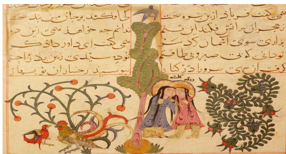
تصویر ۱. وداع ورقه با گلشاه، مکتب سلجوقی.

چهره‌ها در ورقه و گلشاه همچون ماه با چشمان بادامی و لبانی غنچه است (تصویر ۱). عیوقی این گونه چهره‌ی گلشاه را توصیف نموده است: یکی سرو بون بود آراسته/بته چون بهاری پراز خواسته یکی گوهری بود پر نام و ننگ/یکی گلشنی بود آراسته مرو را پدر نام گلشاه نهاد/ که خورشیدرخ بود و حور انژاد (عیوقی، ۱۳۴۳: ۶)