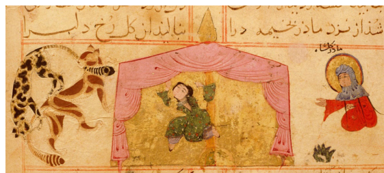
تصویر ۶. نبرد دو گریه‌سان در گوشه‌ی چپ تصویر، مکتب سلجوقی، بنظر ذهن مشوّش گلشاه را نشان می‌دهد.