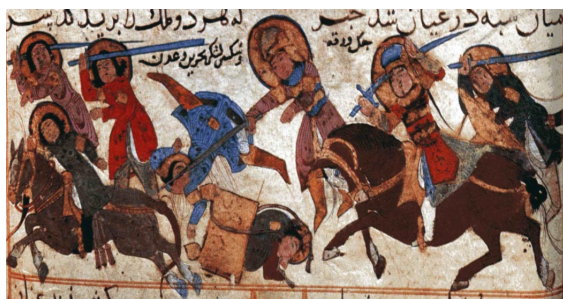
تصویر ۳. شکست لشکریان بحرین و عدن در مقابل ورقه، مکتب سلجوقی، شخصیت‌های مثبت و منفی دارای هاله هستند.

– پرکردن فضاهای خالی نقاشی با تزئینات گل و گیاه که میل به عروج دارند به سبک حجاری ساسانیان (تصاویر ۴-۵). ارتورک معتقد است