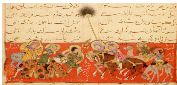
تصویر ۷. ورقه سوار بر اسب قهوه‌ای خالدار در نبرد با لشکر عدن، مکتب سلجوقی. منبع: (URL1)