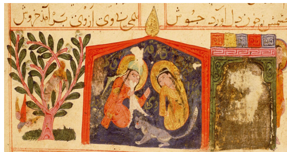
تصویر ۲. دیدار ورقه و گلشاه، مکتب سلجوقی، نقاش کوشیده تصویر را در کادر مورد نظر کاتب جای دهد و برای مثال درخت را کوتاه‌تر از مقیاس واقعی کشیده است.