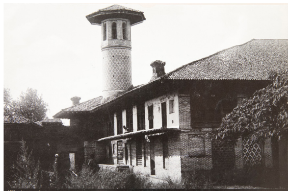
تصویر ۱۴. مسجد جامع، دوره قاجار، رشت.

۱۴). از اطلاعاتی موجود در تصویر (۷) نیز این گونه برمی‌آید که پیشینه‌ی عکاسی از ابنیه در دوره پهلوی اول جهت آگاهی و گزارش دادن همچنان متداول بوده و این مأموریت به دستور دولت بوده که توسط عکاسان اجرا می‌گردید.