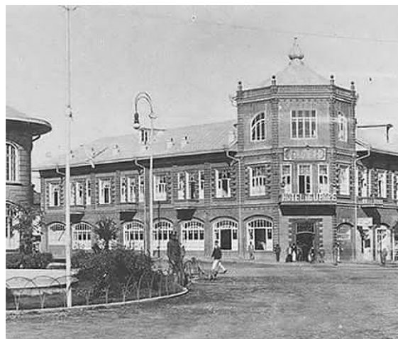
تصویر ۱۰. منظره هتل ایران قدیم یا مهمانخانه اروپا، دوره‌ی پهلوی اول، رشت.