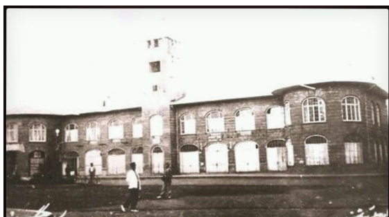
تصویر ۶. ساختمان شهرداری، عکاس: مسیو سورن، دوره پهلوی اول، رشت. منبع: (آرشیو آقای علیپور)