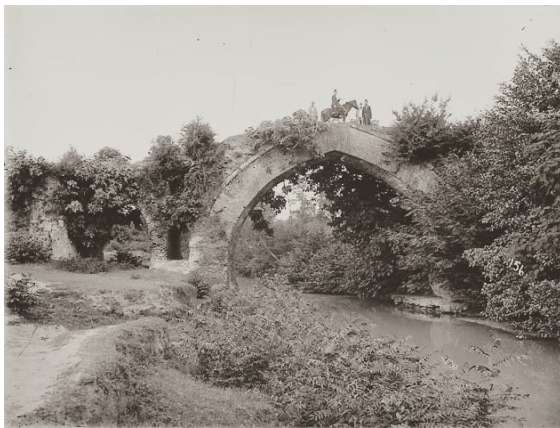
تصویر ۱۳. پل کاروان‌رو، دوره قاجار، رشت.

وجود طبیعت زیبای شهر رشت، عکاسان داخلی اشتیاقی برای ثبت این گونه تصاویر نداشتند که گمان می‌رود ناشی از خواست حاکمیت موجود برای نشان دادن توسعه و تجدد شهری بوده است.