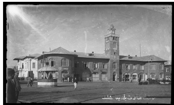
تصویر ۱. عمارت بلدییه، دوره‌ی پهلوی اول، رشت.

اولین سفارش‌هایی که به عکاسخانه‌ها داده می‌شد، چاپ عکس برای اوراق شناسایی و گواهی‌نامه‌هایی بود که واحدهای مختلف حکومتی صادر می‌کردند. در حقیقت عکس‌گرفتن برای اوراق شناسایی، سال‌های سال بخش عمده‌ای از کار عکاسخانه‌های عمومی را تشکیل می‌داد.