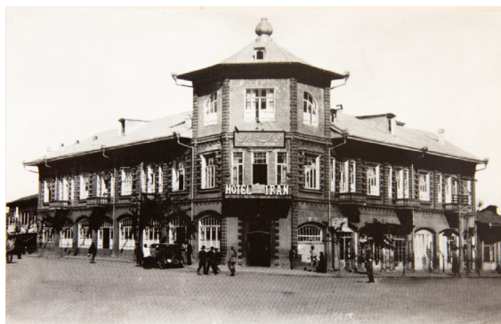
تصویر ۹. عمارت هتل ایران، دوره‌ی پهلوی اول، رشت.