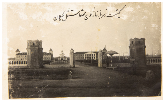
تصویر ۱۱. سربازخانه رشت، سال ۱۳۱۰.

عکس برداری ساختمان عکس برداری ساختمان وزارت داخله به بلدیہ رشت اشعارداشته که وزارت داخله در صدداست مجموعه از عملیات و آبادی هائی که مؤسسات بلدی می نمایند ترتیب داده قسمتی از آن ها را در سالیانه بلدیہ ها طبع کنند لازم است قبل از اقدام با ساختمان یا تعمیر و تغییر اینکه بیک محل داده خواهد شد عکس محل مزبور را برداشته پس از اتمام عمل مجدداً عکس دیگری بردارند از هر یک دو قطعه باین وزارتخانه بفرستند