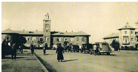
تصویر ۲. چشم‌انداز عمارت بلدییه، دوره‌ی پهلوی اول، رشت.

در تمامی تصاویر منظره شهری حضور انسان‌ها در شهر نمایان است و عکاس تشویشی برای ثبت انسان‌ها در تصاویرش ندارد و این شاهدهی بر پیشرفت فنی در دوربین‌هاست که برخلاف ادوار گذشته، عکاس برای تهیه عکس از ابنیه، به علت حساسیت پایین فیلم‌ها و حرکت انسان‌ها که باعث لرزش در عکس می‌شد، ملزم به خلوت نمودن صحنه‌ی عکس از