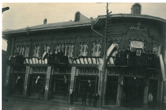
تصویر ۸. ساختمان بانک پهلوی، دوره‌ی پهلوی اول، رشت.

نمای ورودی و ساختمان‌های باشکوه سربازخانه‌ی رشت در تصویر (۱۱) به همراه قراول‌خانه که در آن دوران به سبک اروپایی ساخته شد، و دو برجک در ورودی این سربازخانه دیده می‌شود. این بنا نیز در روزگار خود از معماری بی‌رقیبی بهره می‌برد.