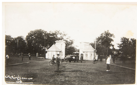
تصویر ۵. ورودی سبزه‌میدان، عکاس: مسیو سورن، سال ۱۳۱۰، رشت. منبع: (آرشیو روبرت واهانیان)