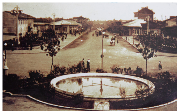
تصویر ۳. منظره‌ی میدان بلدییه، سال ۱۳۱۳، رشت.