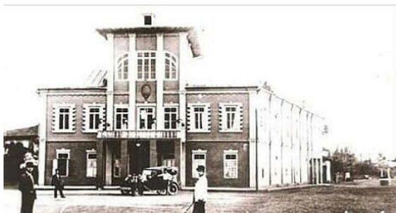
تصویر ۴. نمای مرصخانه بلدییه، عکاس: مسیو سورن، دوره پهلوی اول، رشت. منبع: (آرشیو کیوان پندی)

به موازات نوسازی شهر رشت، عکاسی معماری هم‌راستا با این جریان بسیار رایج گشت. در تصاویر (۴ تا ۶) که توسط مسیو سورن، عکاس ارمنی تهیه گردیده، همواره دو فرد، یکی با کت و شلوار تیره و دیگری با کت و شلوار سفید در عکس‌ها مشاهده می‌شوند. کت و شلوار به‌عنوان سبک پوشش جدید، بخشی از سیاست‌های تجدیدطلبانه حکومت وقت بود. در کتاب «عکاسان و عکاسخانه‌های گیلان» چنین آمده که احتمال می‌رود یکی از این افراد داخل عکس، مسیو سورن باشد. اگرچه این گمان هم وجود دارد که او از دستیاران خود در عکس‌ها بهره می‌برده و نشانی از خود به‌عنوان عکاس برجای می‌گذاشته که اکنون این تصاویر مبدل به امضای مسیو سورن گشته‌است. اگرچه تعداد کمی تصاویر از این عکاس در دست می‌باشد، اما طبق اسناد موجود می‌توان این‌گونه تحلیل نمود که مرکز توجه مسیو سورن و بسیاری از دیگر عکاسان در این زمان، عکاسی از معماری، بافت شهری و معرفی یک بنای خاص همچون ساختمان پست،