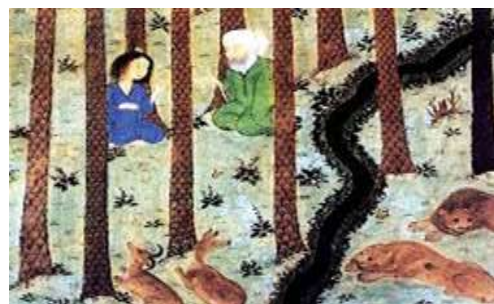
تصویر ۴. سلیم لیلی را برای ملاقات با مجنون به نزد اومی برد. منبع: (خمسه نظامی، شیراز، ۸۸۱ هجری قمری / ۱۴۷۶ میلادی)