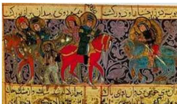
تصویر ۲. رقه و گلشاه، شیراز، مکتب سلجوقی. نیمه اول سده‌ی هفتم قمری