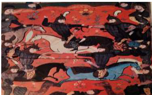
تصویر ۵. پرده نقاشی از شاهنامه فردوسی، مبارزه ی اردشیر با بهمن اردوان مربوط به دوره صفوی.

روش این تحقیق کیفی و رویکرد آن توصیفی و تحلیلی و بر مبنای مطالعه موردی انجام می شود. در این روش منابع اصلی مورد استفاده، اسناد