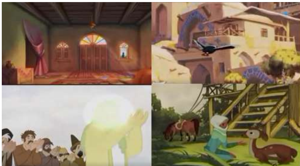
تصویر ۹. تصاویری از انیمیشن آقای مهربان.

همه و همه به فضا سازی این انیمیشن مذهبی کمک کرده (تصویر ۹).