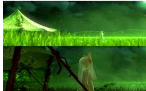
تصویر ۷. تصاویری از انیمیشن شاهزاده روم. تصویر ۸. تصاویری از انیمیشن شاهزاده روم.