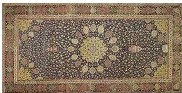
تصویر ۱. قالی شیخ صفی‌الدین اردبیلی. مربوط به ۹۲۹ هجری

«قالی شکارگاه» نیز یکی از قالی تاریخدار ایران است. در این فرش نقش لچک ترنج وجود دارد. رنگ متن آبی سیر بوده و زمینه ترنج و لچک و حاشیه اصلی سرخ خوش رنگ و حاشیه باریک زرد است. رنگ‌های سرخ، آبی، زرد از رنگ‌های اصلی دایره رنگ می‌باشد. نقش متن عبارتست از شاخه‌های نازک درهم به رنگ سبز با برگ و شکوفه ریز و گل‌های ختائی و ستاره‌ای به رنگ گوناگون. در زمینه ترنج و گله‌گله ابر به رنگ آبی روشن و گرداگرد آن لک‌لک‌ها و مرغابی‌هایی به‌طور قرینه در پروازند. حاشیه اسلیمی آن دوگانه است یکی به رنگ لاجوردی و دیگری آبی بسیار روشن که هر کدام شاخه نازکی را با غنچه‌ها و گل‌های مینا و ختائی در سراسر طول خود در بر می‌گیرد و از درهم شدن اسلیمی‌ها کلاله‌های کم‌و بیش بیضی‌شکل به‌دست می‌آید که در میان سبز و نخودی است و در وسط هر یک گل ختائی دیده می‌شود. شاخه‌های نازک به رنگ آبی روشن و شکوفه‌ها به رنگ‌های آبی و