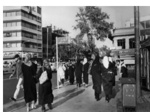
عکس ۶. لاله رهبر، از تجریش تا راه‌آهن، ۱۳۷۹

دوره محدود آثار خود در زمینه عکاسی خیابانی را در گالری‌های خصوصی و با نگاه و بینش شخصی خود به نمایش گذاشتند.