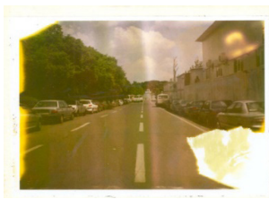
عکس ۱۲. محمد غزالی، بدون عنوان، ۱۳۹۲

مسافران است. عکاس در تجربه پرسه‌زنی در خیابان انقلاب و در سیروسلوک عکاسی‌اش در خیابان‌ها قدم می‌زند و به مکاشفه آن چه در روزمرگی این مکان پنهان شده می‌پردازد (عکس ۱۴). عکس‌های مجموعه «جای سرخوبان»، اثر محمد غزالی در نگاه اول بسیار معمولی‌اند. زاویه دید خیلی عادی، تصاویر تکراری شهر تهران، رنگ‌های غیر طبیعی، در بعضی از آنها حتی اشتباه نورسنجی دیده می‌شود. اما عنوان عکس‌هاست که توجه زیادی را به خود جلب می‌کند و علت آن نگاه به شهر از دید پیکره‌های کار گذاشته شده در گوشه و کنار شهر است (عکس ۱۵). عکاس به جای مجسمه‌ها به شهر نگاه می‌کند و ما را هم در این جایگاه شریک می‌کند. در تصاویر سکون، نگاه خنثی و خالی از احساساتی‌گری،