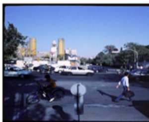
عکس ۱۵. محمد غزالی، سید محمد حسین بهجت تبریزی متخلص به شهریار، شاعر سده ۱۳ و ۱۴ ه.ش، ۱۳۹۰

می‌نمود، این بار بر سیمای فردی که دیگر در میان ما نیست تصویر شده، مانند خونی که از او بر شهر و اثر جاریست. حضوری که به اثر جهت می‌دهد و چندگانه می‌دهد و تبدیل به علامت سؤالی در ذهن مخاطب می‌شود (ثابت زاده، ۱۳۹۲: ۸۷).