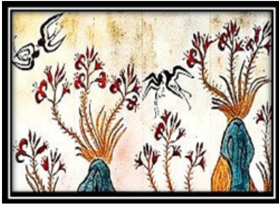
۶. نقاشی پرستوها و گل (Martino, 2005: 69, Larsen, 2011: 16-37)