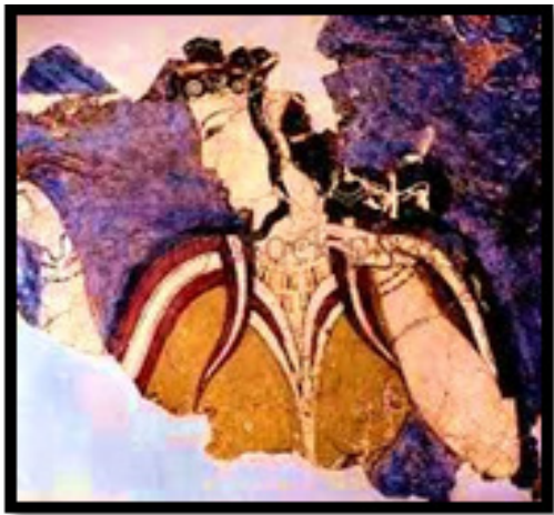
۷. نیم‌رخ زن میسنی (Demargen, 19. Schneider, 2001: 73, Matz, 1962: 76, 108. Ibid, 58)

هنرغنی مصر قرار داشتند. با فروپاشی تمدن مینوسی در کرت، تمدن میسنی در یونان ۲۹ برتری می‌یابد. وقوع جنگ‌های متعدد با ساکنان بومی یونان باعث می‌شود تا میسنی‌ها دژها و حصارهای متعددی حول سرزمین خود بنا کنند. این دژها تا ۱۲۰۰ پ.م. آنها را در پناه خود قرار داد (وودفورد، ۱۳۸۶: ۳۷، ۳۶).