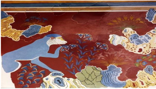
۳. دیتیل نقاشی دیواری میمون آبی رنگ بر روی صخره در حال چیدن گل زعفران. ۱۵۰۰ پ.م. موزه هراکلیون (Demargen, 140)