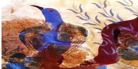
۴. نقاشی دیواری از پرنده به رنگ آبی. ۱۵۰۰ پ.م. کاخ کنوسوس. موزه هراکلیون (Honour, 1984: 78, Demargen, 140) (هارت، ۱۳۸۴: ۱۴۹)

نقش بسته‌اند که بیشتر از موضوع هائی مانند منظره و یا موضوع انسانی مشابه کارهای انجام شده در کنوسوس است (Martino, 2005: 4-6).