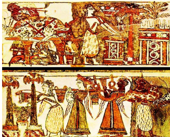
۵. هنرمینوئی، نقش زنان و مردان درهاگیا. نقاشی بر روی سارکوف‌گوس (Dawn Cain, 1997: 27, Martino, 2005: 83, Larsen, 2011: 67, 16-37, Demargen, 80, Honour, 1984: Mathz, 1962: 8)

نیم‌رخ جنگجویان در تصویر ۸ که بر روی جام نقش بسته و براساس قرار داد ترسیم شده را نشان می‌دهد. سر و پاها از نیم‌رخ و تنه از روبرو است. در هنرکنوسوس هم، نیم‌تنه زنان از روبرو کار می‌شد. جنگجویان نیز که با خطوط واضح و