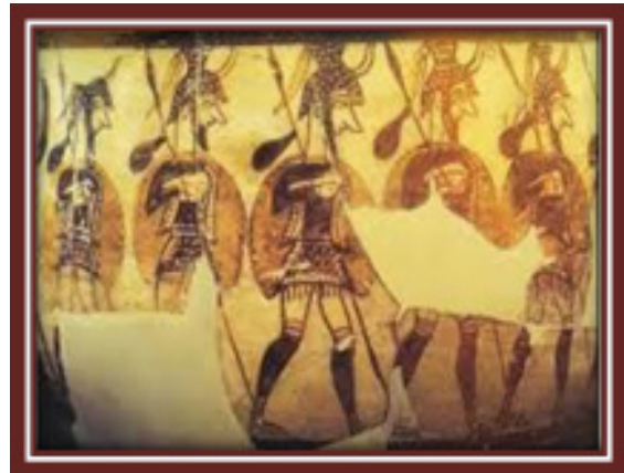
۸. جنگجویان میسنی نقاشی شده بر روی جام

با توجه به نتایج آزمون ضریب همبستگی اسپیرمن ملاحظه می‌گردد که سطح معنی‌داری بالای ۰,۰۵ به دست آمده است که گواهی از وجود رابطه بین این دو ندارد. به بیان دیگر نقاشی‌های کاخ تیرنس