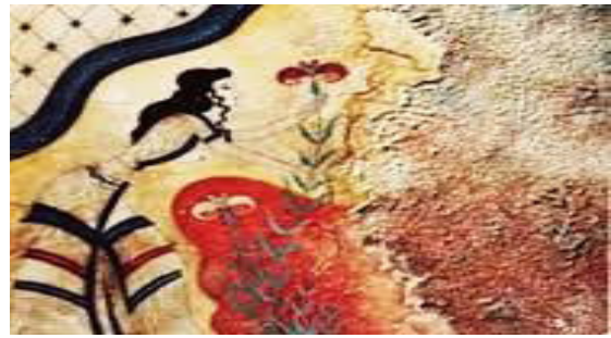
۲. نقاشی دیواری زنی در حال چیدن زعفران، کاخ کنوسوس (www.World Media.com, 2018)