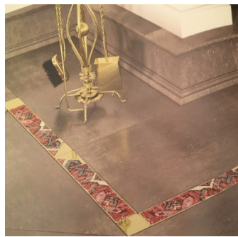
تصویر ۵. کف پوش با تکه فرش‌های مستعمل و کهنه در فضای داخلی منزل، مسابقه بزرگ طراحی و خلاقیت در صنایع دستی معاصر ایران، بهار ۱۳۹۶ (هوشیار، ۱۳۹۶: ۳۷)