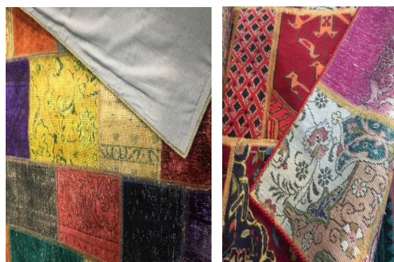
تصویر ۲. نمای پشت و روی فرش پیچ ورک (چهل تکه)، نهمین نمایشگاه بین‌المللی میدکس، تهران، ۱۳۹۷

علاقه نشان داده و برای آنها ارزش قائل هستند. اخیراً این فرش‌ها در کشورهای اروپایی و آمریکایی بسیار مورد توجه قرار گرفته است. از همین رو صادرات این فرش‌ها از رونق خوبی برخوردار است (تصویر ۳).