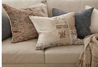
تصویر ۶. نمونه‌هایی از پاف و کوسن با رویه‌ی فرش‌های مستعمل در فضای داخلی منزل