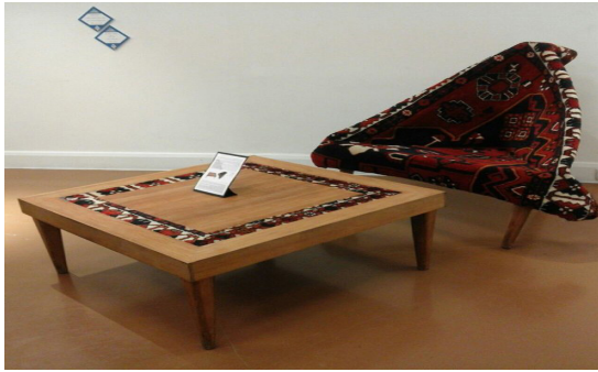
تصویر ۴. نمونه‌ای از میز و صندلی با تکه فرش‌های کهنه و مستعمل در فضای داخلی، مسابقه بزرگ طراحی و خلاقیت در صنایع دستی معاصر ایران- بهار ۱۳۹۶ (هوشیار، ۱۳۹۶: ۱۲۵)