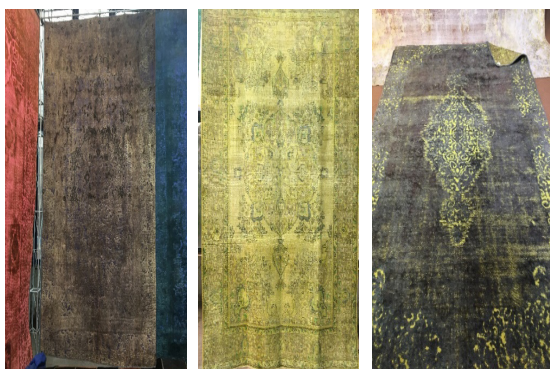
تصویر ۳. فرش وینتیج، نهمین نمایشگاه بین‌المللی میدکس، تهران، ۱۳۹۷