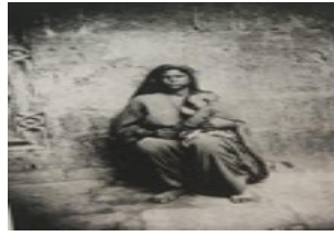
تصویر ۴. عکاس: اوگوست روزالی رابینسون، مصر (جهانگردان در سرزمین مصر باستان ۱۸۶۹)

این بازنمایی‌ها به شیوه‌های گوناگون توسط غربیان تفسیر می‌شد و شرق ملاک سنجش برای غربیان بود. ملاکی برای دیدن و رویاپردازی که ساختار اساسی آن را می‌توان در اندیشه مدرنیته جستجو کرد. در حقیقت، با ورود مدرنیته، فرهنگ غربی هر