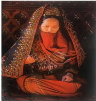
تصویر ۸. زن ترکمن از طایفه تکه (مجموعه ترکمن‌های ایران)

تمامی بازنمایی‌های بصری به شیوه‌های مختلفی ساخته می‌شوند و احتمالاً شرایط تولیدشان در تأثیرهایی که بر جامی گذارند، نق‌ش دارد. بعضی استدلال می‌کنند، تکنولوژی‌های به کار گرفته شده