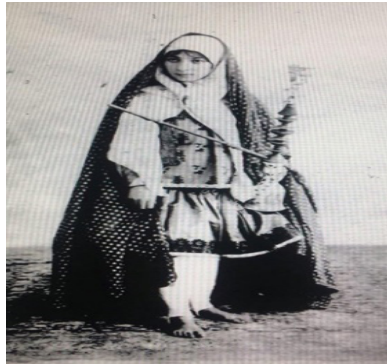
تصویر ۱. زنی با قلیان سوریوگین (ایران از نگاه سوریوگین)