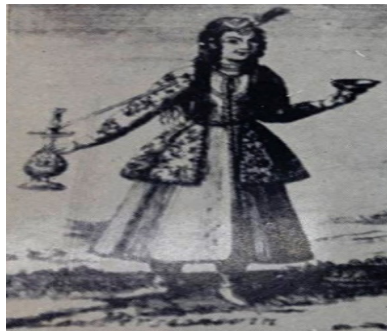
تصویر ۲. زنی با قلیان - فرانتز کاسپار شیلینگر (اسناد مصور اروپائیان از ایران)

«مؤسسه اسمیتسونین» با مجموع ۱۰۷۶ عکس از سوریوگین (۵۲ عکس با موضوعیت زن) عکس‌های سوریوگین به دو بخش، عکاسی از زنان با صحنه‌پردازی در داخل استودیو و عکاسی از زنان در خارج از استودیو تقسیم و مورد مطالعه قرار گرفته است. تصاویر نصراله کسرائیان نیز از سه مجموعه‌ی وی (ترکمن صحرا، کردستان و شمال)، انتخاب شده‌اند که در این میان با توجه به محتوای تصاویر، عکس‌ها به دو بخش، زنان با انتزاع از زندگی روزمره و زنان در محیط زندگی روزمره (کار)، تقسیم و مورد مطالعه قرار گرفته است. شایان ذکر است که انتخاب تصاویر در نسبت با کار عکاسانه و بر مبنای کارآمدی مطالعه تطبیقی عکس‌ها و بر اساس مضامین مورد نظر این پژوهش بوده است.