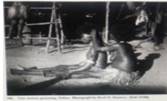
تصویر ۶.