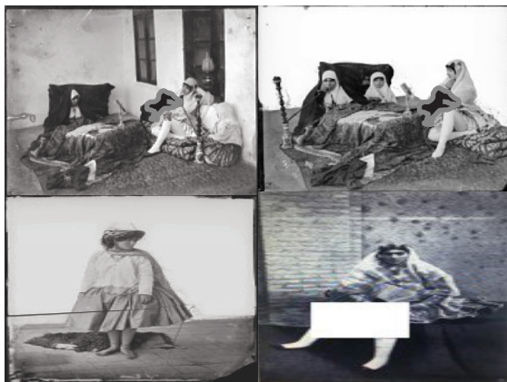
تصاویر ۳. زنان در اندرونی‌ها (Through Persia on a Side-Saddle)

در این تصاویر سوم، شکل آرایش موها، حالت‌های ایستادن، نشستن و خوابیدن، به کارگیری عناصر بصری، همه در بستر جنسیت و هویت است که معنا می‌شوند. ملاک معنا، دیده شدن این زن‌ها هستند در اندرونی‌ها. «چرا که در آن زمان سکس‌والیته به منزله‌ی یکی از عناصر نیرومند خیال‌پردازی بر ساخته‌ی غرب، جایگاه پیچیده‌ای در گفتمان‌های شرق‌شناسانه داشت، رابطه‌ی بین زنان، دیگری و شرق در قرن نوزدهم به عنوان موضوعی در هنر ادامه