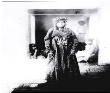
تصویر ۸. عکاس: سوریوگین یک زن کلدانی (ایران از نگاه سوریوگین)

توجه سوریوگین به کیفیت نور در تصاویرش باعث تأکید بر جزئیات و شخصیت آنها شده است. شیوه او در نورپردازی، متأثر از نورپردازی رامبراند است. در تصاویر او نور با زاویه‌ای مورب و از سمت بالا وارد محیط شده و بر موضوع می‌تابد.