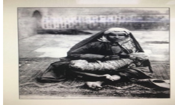
تصویر ۵. عکاس: سوریوگین (ایران از نگاه سوریوگین)