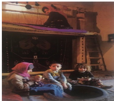
تصویر ۱۴. عکاس: کسرائیان دختر قالیباف، روستای بلبان (مجموعه کردهای ایران)

کادری عمودی به خوبی بلندی دار قالی را به تصویر کشیده است. او موقعیت خود را با توجه به مقتضیات سوژه تغییر می‌دهد تا مخاطب بتواند به بهترین شکل به چستی و چرایی تصویر پی ببرد. او در نقش یک مفسر و مشارکت‌کننده فعال و در بهترین حالت به تفسیر موضوع و ایجاد معنا برای مخاطب می‌پردازد.