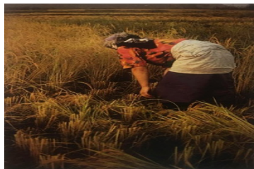
تصویر ۱۲. عکاس: کسریانیان زن دروگر نزدیک آستارا (مجموعه شمال ایران)