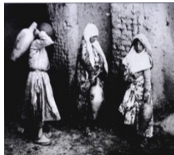
تصویر ۷. عکاس: سوریوگین، دختران فقیر در حال برداشتن آب از سرداب (ایران از نگاه سوریوگین)

او همچنین به تمامی جزئیات ترکیب‌بندی توجه دارد. استفاده او از پس‌زمینه و قراردادن مناسب عناصر در کادر تصویر، استفاده از فاصله کانونی، دیافراگم و زاویه دید دوربین نسبت به افراد که اغلب هم‌سطح و رو به بالاست، ایجاد فضای مناسب برای تمامی عناصر تصویر، توجه او به پوشش (لباس) به عنوان نمادی در جهت تشخیص هویت بومی و محلی و از همه مهم‌تر توجه به حالات و جنبه‌های بدنی افراد است که مورد توجه قرار می‌گیرد. چرا که در مطالعات انسان‌شناسی تصویر محور، «محوریت پژوهش در بدن بر معنا و نماد استوار است. بدن با شرایط تغییرناپذیر، تفاوت‌های اجتماعی، بنیادهای طبیعی و فیزیکی در ارتباط است. از نظر هر تزی، الگوهای فکری در بدن منعکس می‌شوند. از نظر موس، اولین و طبیعی‌ترین ابزار انسان بدن است. بدن دارای اهمیت ذاتی بوده و بر همین اساس از توانایی‌ها و یا محدودیت‌هایش در فرهنگ استفاده می‌شود» (عزت‌اللهی‌نژاد، ۱۳۹۴: ۱۳۵).