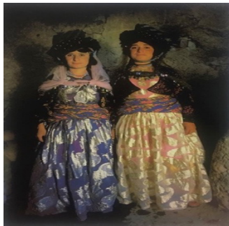
تصویر ۹. دو ساقدوش عروس نزدیک سقز

قراردادن خودخیالی در مقابل نگاه کسی که ممکن است وجود داشته باشد. ژست گرفتن در مقابل دوربین عکس‌العملی در برابر نگاه منجمدکننده دوربین است» (گونزالز، ۱۳۸۶: ۵۴).