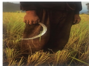
تصویر ۱۳. عکاس: کسریانیان مرد دروگر نزدیک آستارا (مجموعه شمال ایران)

در ساخت تصاویر، شکل، معنا و تأثیر آن را تعیین می‌کنند. تکنولوژی‌های بصری در اینکه یک تصویر چگونه دیده شود و بنابراین در کاری که یک تصویر انجام می‌دهد و کاری که در مورد آن انجام شده است، موضوعیت دارد. کسریانیان در مصاحبه‌ای که با حمیدیان در مجله حرفه و هنرمند داشت، اظهار می‌دارد که از لنز تله فوتوی زوم ۸۰۰-۲۰۰ برای ثبت تصاویر استفاده کرده است. وی دلیل این انتخاب را عدم پذیرش عکاس در میان مردم در سی سال پیش می‌داند و این به دلیل تجربه تلخی بوده که در بلوچستان به واسطه عکاسی از یک زن بلوچ داشته است، تجربه‌ای که با پادرمیانی همراهان بومی به خیر ختم می‌شود. شاید به همین دلیل، اغلب کادربندی‌های کسریانیان از زنان از یک موضع دور دست گرفته شده‌اند.