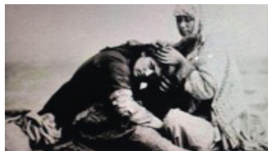
تصویر ۷. عکاس: سوریوگین (ایران از نگاه سوریوگین)

یافت و به دلیل عجیب و غریب بودن شرق، با توهم‌های جنسی همراه گشت. زنانگی نماد شرق محسوب می‌شد. در گفت‌وگو شرق‌شناسی، شرق بیشتر موجودیتی زنانه، منفعل، مطیع و نامقبول بود و لاجرم مستدعی سلطه و کنترل قدرت مردانگی و عقلانیت غربی» (عباس‌زاده، ۱۳۹۰: ۲۱۸). اهمیت این تصاویر در استفاده آنها برای بینندگان اروپایی بود.