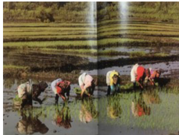
تصویر ۱۱. زنان شمال (مجموعه شمال ایران)