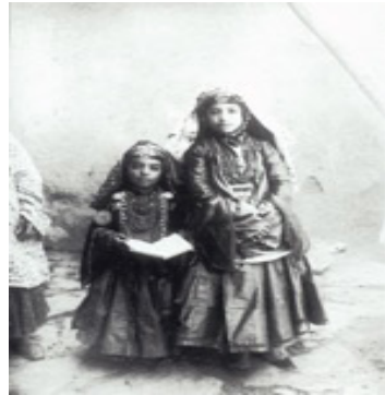
تصویر ۶. دو دختر متمدول از ایل شاهسون (ایران از نگاه سوریوگین)

در واقع تمهیدات سوریوگین در فرم‌دهی به سوژه‌ها و توجه به حالات بدنی آنها در جهت هویت‌سازی برای آنهاست. واقعیت این است که «حالت نشستن یا زانو زدن یا ایستادن هر فرد نه فقط با محدودیت‌های فیزیکی او بلکه با فرهنگ و روابط اجتماعی او شکل‌های مختلف می‌گیرد. حالات مردم دنیا همان‌قدر متنوع است که پوشاک و اثاثیه و خوراک و موسیقی آنها. توجه به حالت و فرم بدن در تعیین شخصیت و نحوه قضاوت ما در مورد انسان‌ها همان اندازه مهم است که توجه به سخن گفتن آنها. به طور کلی ژست گرفتن را می‌توان پاسخ سوژه به تماشای احتمالی دانست.