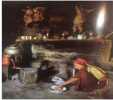
تصویر ۱۳. زن دامدار یموت در حال درست کردن پنیر، منطقه جرگلان (مجموعه ترکمن‌های ایران)

تصویر چهاردهم سه کودکی را نشان می‌دهد که با بقایای گرمای تنوری که در آن نان پخته شده، پاهای خود را گرم می‌کنند و خواهر بزرگ‌تر قالی می‌بافد. با وجودی که کودکان در پیش زمینه به تصویر کشیده شده‌اند، اما نگاه دخترک قالی‌باف که در مرکز کادر یک‌سوم بالا قرار گرفته است، ما را به سمت خود می‌کشاند. قالی میان او و کودکان فاصله انداخته است. فاصله‌ای میان او و کودکی‌اش. پله‌های نردبان که در گوشه سمت راست تصویر به دیوار تکیه داده، شاید حکایت از تعداد زمانی است که او صرف بافتن این قالی کرده است. قرارگیری درست عکاس با توجه به مقتضیات سوژه موجب ایجاد حس عمق در این تصویر گردیده است. نور موربی از سمت پنجره به داخل تابیده است که بخشی از آن بر روی قالی و بخشی دیگر بر روی صورت کودکان در کنار تنور تابیده شده است. کسرائیان با