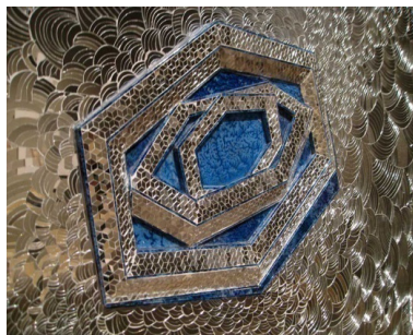
تصویر ۴. فرمانفرمایان، آینه، ۲۰۱۵، موزه گوگنهایم (www.guggenheim.org)