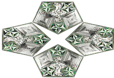
تصویر ۲. فرمانفرمایان، ۱۳۸۰، آینه، عنوان: خانواده سبز (www.nytimes.com)