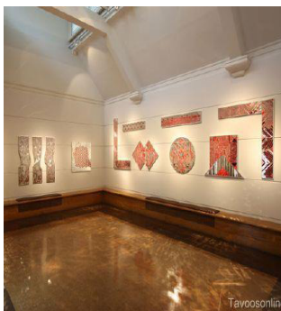
تصویر ۶. فرمانفرمایان، آینه، نمایشگاه خط سوم دبی، ۱۳۸۷

بهره می‌گیرد. او معنای نهایی اثر را در تکرار و انعکاس آینه‌ها در یکدیگر و شکست نور می‌بیند. شکست در آینه‌ها به صورت بازنمایی نمادین و هندسی است که به باور هنرمند بر تکرار و تکرار و وحدت اشاره دارد. به باور فرمانفرمایان هندسه در آثار او کامل نیست. ساده‌سازی تجسمی فرم و نبود رنگ در آثار او (گاهی اندک)، تمایل به سطوح هندسی و عدم تکامل را نشان می‌دهد. در آثار او تکرار فرم‌های هندسی نشان از زندگی، باروری، زنانگی را به مخاطب الهام می‌کند. شکل‌های ساده شده آینه‌ها به صورت شش‌وجهی یا ساده، همراه با بیان عاطفی، ترکیب‌بندی‌های متقارن و نامتقارن در کنار یکدیگر با فن آینه کاری کامل می‌شود. او از فن آینه برای برجسته کردن و انعکاس معانی استفاده می‌کند. تأکید بر هندسه و عناصر فرمی محدود در آثار او نماد تحرک، نظم و معنا است. در آثار فرمانفرمایان معنا حاصل هویت زنانه و طبیعت و فرهنگ نمادین است. در آثار او تناقض و تقابل در کنار هم دیده می‌شود و هویت زنانه با شکست‌ها و تناقضات فرمی نشان داده می‌شود. در این بخش به مطالعه آثار فرمانفرمایان با آراء لوسی لیپارد پرداخته می‌شود. در آثار او حفره خالی در اکثر کارها وجود دارد و آثار تکه‌تکه شده است و تکرار می‌شود، امری که لیپارد تأکید می‌کند در آثار زنان دیده می‌شود و ماهیت زنانه را به تصویر می‌کشد. آثار او دارای ترکیب‌بندی‌هایی است خرد شده است که می‌تواند رنج‌ها و تناقض‌ها و ناخودآگاه هنرمند را به تصویر می‌کشد و لیپارد معتقد است زنان آثارشان به صورت تکه‌تکه‌های خودشان