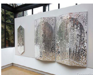
تصویر ۷. فرمانفرمایان، آینه، موزه ویکتوریا آلبرت، لندن

زیبایی است (اکرمی، ۱۳۸: ۹۵). «هندسه مقدس (صورت‌های هندسی نقش بسته در آفرینش‌های هنر اسلامی) نمادپردازی سنتی‌ای از ازلیت کیهانی است که همه چیز آن کامل، بی‌نقص و باقاعده است. این نقش‌ها با انتظام و قاعده واحدی که در ترکیب و موقعیت نسبی جزءها در کل دارند، دریافتی از تربیت ناخودآگاه آفاق وانفس را در ذهن تداعی می‌کنند، قانون واحدی که کل کیهان را رقم زده است و نیز با پیوستگی این تناسبات زیبایی‌شناسانه در تقابل با تکرار آن معنای وحدت (توحید) و عدد واحد را یادآور می‌شود، چرا که در هنر سنتی اصل و حقیقت واحد و ثابت‌اند و صورت زیبا صورت تکراری نیست بلکه صورت تکامل‌یافته‌ای است که به سبب این تکامل معنا را بیشتر در خود جای داده است. در این میان نظام عناصر و اجزای تصویر هندسی نشانگر مرتبه وجودی هر جز در نظام کلی هستی است. بدین سبب نقوش هندسی از دیگر اشکال