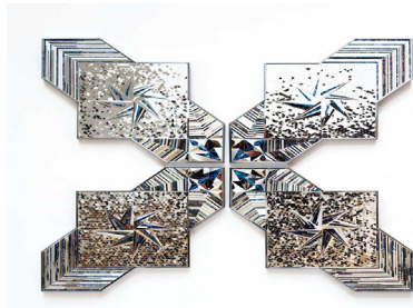
تصویر ۵. منیر فرمانفرمایان، موزه ویکتوریا و آلبرت

جهان می‌شوند، با آینه‌هایی که جزئیات را انعکاس می‌دهند (Shahroudy Farman- (farmaian, 2008: 109). آثار او متشکل از کلاژهای آینه‌ای شکسته تشکیل شده است، او آینه‌ها را بازتابی از زندگی شخصی و طولانی خود می‌داند. او معتقد است آثارش متأثر از زندگی خانوادگی، جدایی، تبعید، زندگی در مکان‌های مختلف جهان، از دست دادن زندگی‌اش در ایران و عزیزان بخصوص همسرش، فرزندان و مراحل مختلف زندگی او الهام می‌گیرد (Shahroudy Farmanfarman, 2007: 98).