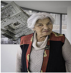
تصویر ۱. منیر فرمانفرمایان، ۱۳۸۶، موزه ویکتوریا و آلبرت