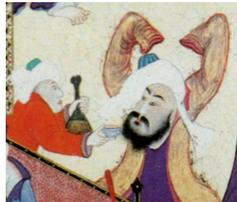
تصویر ۷. بخشی از نگاره مستی لاهوتی و ناسوتی