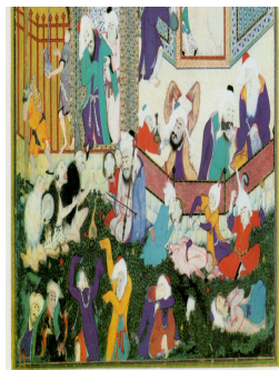
تصویر ۳. بخشی از نگاره مستی لاهوتی و ناسوتی

نوازندگان، رقصندگان، موجودات عجیب شبه‌انسانی، خفتگان، پیکره‌های مست و ناهشیار، سبکشان. پیکره‌های مربوط به فضای داخلی ساختمان و میانه نگاره: شاهدان و خوئیرویان، ساقیان، پیر لمی‌ده (پیر مغان). پیکره‌های مربوط به بخش پشت‌بام ساختمان و قسمت بالای نگاره: