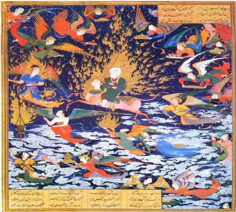
تصویر ۱۵. معراج پیامبر (ص)، اثر سلطان محمد، خمسه نظامی