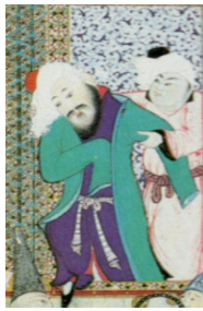
تصویر ۶. بخشی از نگاره مستی لاهوتی و ناسوتی