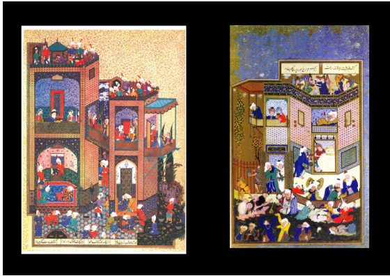
تصویر ۱۲. مقایسه نگاره مستی لاهوتی و ناسوتی اثر سلطان محمد (سمت راست) و نگاره کابوس ضحاک اثر میرمصور، شاهنامه شاهطهماسبی (سمت چپ) (کورکیان و سیکر، ۱۳۹۱: ۱۰۷).

به عالم ناسوت (زمینی)، عالم ملکوت (مثال) و عالم جبروت (عالم معنا) دارد. طی سلسله مراتب سیر نگاه مخاطب از پایین به بالا، نگرستن به صورت‌های متکثر و متنوع در بخش بیرونی ساختمان و پایینی ترکیب بندی نگاره، تا بخش میانی و در نهایت قسمت بالایی ساختمان که محل و جایگاه فرشتگان است، به نوعی سیر و سلوک هنرمند و به تبع آن بیننده را ایجاب می‌کند، که در نهایت وجود تکثر، به نوعی وحدت نیز رهنمون گردد.