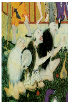
تصویر ۲. بخشی از نگاره مستی لاهوتی و ناسوتی