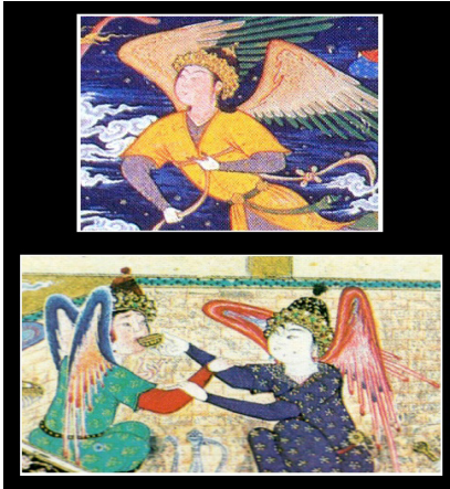
تصویر ۱۶. مقایسه تاج فرشتگان در دو نگاره معراج پیامبر (ص) شاهطهماسبی، ۹۵۰-۹۴۶ ه.ق، کتابخانه بریتانیا لندن. (بالا) و مستی لاهوتی و ناسوتی (پایین) (مأخذ: کورکیان و سیکر، ۱۳۹۱: ۴۳)

تصویر ۱۶). گویا تاج مذکور به نشانه فره ایزدی و مقام آسمانی بدیشان اعطاء شده و در اینجا نیز با تأکید بر همین نشان و دلالت بر آسمانی و لاهوتی بودن این فرستادگان مقدس و نیز متفاوت بودن کیفیت مستی و می‌گساریشان به تصویر کشیده شده است.