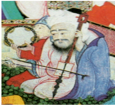
تصویر ۱۳. بخشی از نگاره مستی لاهوتی و ناسوتی