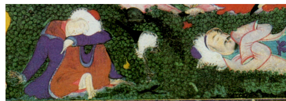
تصویر ۵. بخشی از نگاره مستی لاهوتی و ناسوتی

مست و مدهوش در حال تلوتلو خوردن از درگاه در ساختمان پای به بیرون گذاشته، در حالیکه شاهدی زیباروی، دست بر زیر بغل او گرفته و در این امر او را کمک و مشایعت می‌نماید (تصویر ۷). در قسمت منتهی الیه سمت چپ پلان مذکور نیز، دو پیکره سوکش به چشم می‌خورند، که به نظر می‌رسد وظیفه انتقال قدهای شراب را از قسمت بالکن فوقانی ساختمان برعهده دارند. از قسمت کتیبه سردر ورودی ساختمان نیز امضای سلطان محمد با رقم «عمل سلطان محمد» به چشم می‌خورد (تصویر ۸).