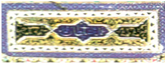
تصویر ۸. کتیبه بخش فوقانی نگاره