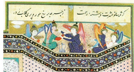
تصویر ۱۱. بخشی از نگاره مستی لاهوتی و ناسوتی

فرشتگان داشته و به نوعی تأکید مضمونی را بیش از بخش‌های دیگر نگاره، بر قسمت بالایی و جایگاه آنان قرار داده است (تصویر ۱۱). فضای ترکیب بندی اثر با خط کادر بسته شده و برخلاف بسیاری از نگاره‌های هم عصر خود، ارتباط با فضای حاشیه اطرافش برقرار نمی‌نماید (تصویر ۱۲).