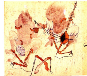
تصویر ۴. مقایسه دیوهای ترسیمی استاد محمد سیاه‌قلم (سمت راست)؛ (مأخذ: کورکیان و سیکر، ۱۳۹۱: ۲۹). و سلطان محمد (در نگاره طهمورث دیوان را می‌کشد، شاهنامه شاه‌طهماسبی) (سمت چپ)؛ (مأخذ: آژند، ۱۳۸۴: ۱۵۲)