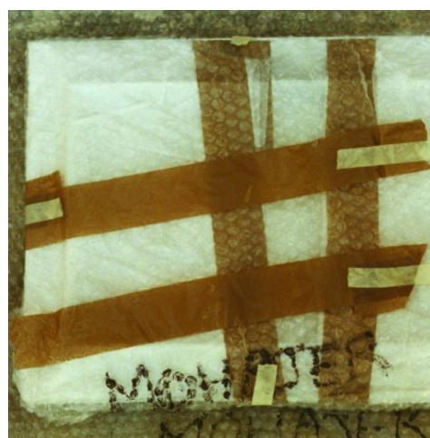
تصویر ۱. مهاجر، مهران. (۱۳۸۳). بسته‌های مهاجر