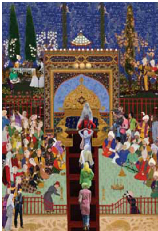
تصویر ۷. شریفی، سودی. (۲۰۱۰). ماکسیماتور، منبع: URL