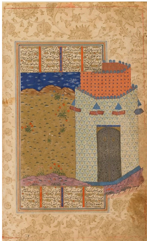
تصویر ۵. رهبر، سارا. (۱۳۹۹). پرچم، منبع: URL5