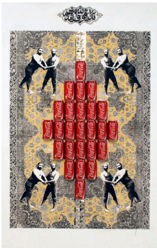
تصویر ۸. سبزی، محمود. (۱۳۹۱). بدون عنوان