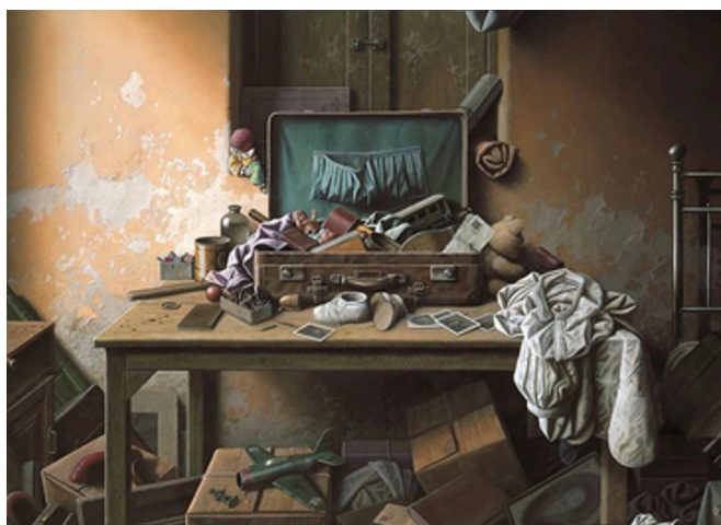
تصویر ۳. خاکدان، واحد. (۱۳۹۹). اسب مهاجر