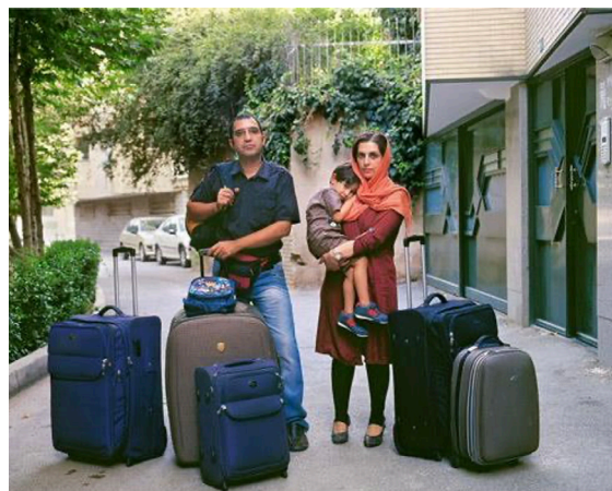
تصویر ۲. صدیقی، بهنام. (۱۳۹۰). روز آخر. URL: 2