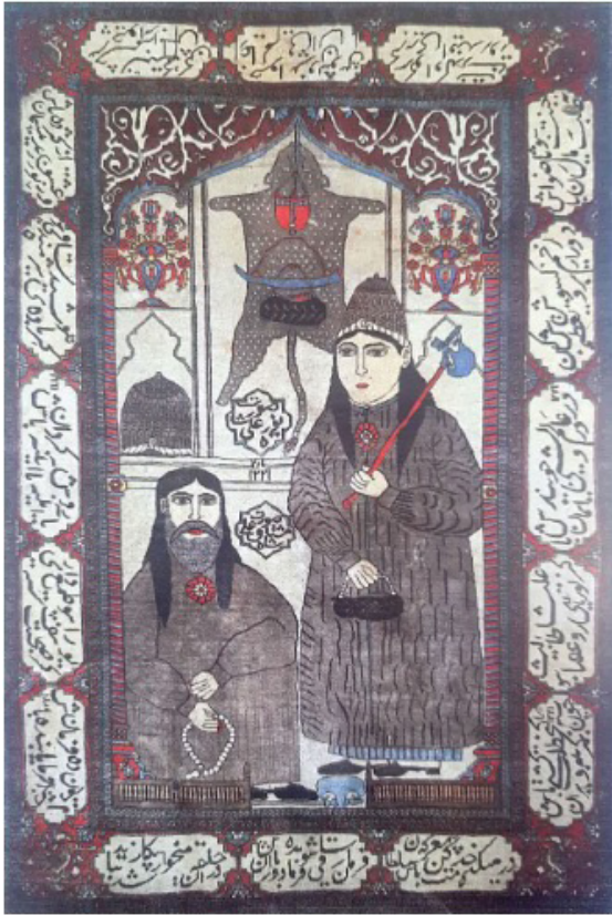
تصویر ۷. قالیچه تصویری با تصویر درویشان، کاشان، (تفاولی، ۱۳۶۸: ۵۹)