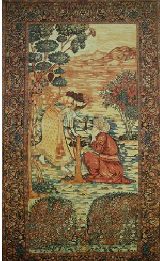
تصویر ۶. باده‌نوشی شیخ صنعان از داستان دختر ترسا، قالی تصویری (یساولی، ۱۳۷۴: ۷۸)

علم به وجود آمد که در نهایت به نام انسان و انسانیت به منصف ظهور رسید. مدرنیته در نتیجه اعتماد و اتکا به عقل انسانی در مقام شناسا به وجود آمد که در نتیجه آن تئوری عدالت، آزادی، حقوق در عرصه سیاسی و اقتصادی ایجاد شد (آشوری و دیگران، ۱۳۷۵: ۱۸۷). تکیه بر انسان و یا اصالت بشر - اومانیسیم - در واقع اساس و بنیاد تمدن غرب است که به عنوان مهم‌ترین ویژگی آن نیز محسوب می‌شود. به عبارتی مسئله اومانیسیم، به لحاظ ایدئولوژیک و مفهومی، محور مباحث دنیای مدرن و حتی پسامدرن به شمار می‌آید (دیویس، ۱۳۹۳: ۱۱).