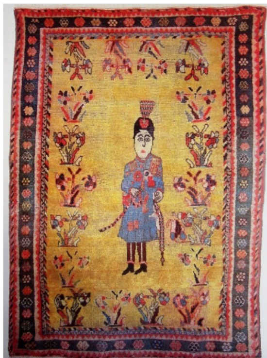
تصویر ۵. قالی تصویری، احمدشاه، متعلق به اواسط قرن چهاردهم هجری، قشقایی، (تناولی، ۱۳۶۸، ۲۳)