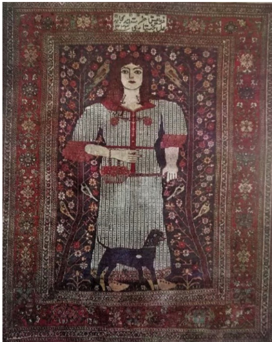
تصویر ۳. قالی تصویری، تک‌پیکره زن، متعلق به اواسط سده چهاردهم هجری، بختیاری، (تناولی، ۱۳۶۸: ۲۹۳)

در نتیجه این اتفاق، شکل انسان از نمونه آرمانی و مثالی، به انسان این جهانی تغییر ماهیت داد؛ نمایش ویژگی‌های فردی