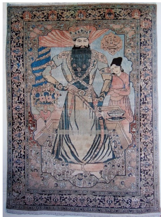
تصویر ۴. قالی تصویری، فتحعلیشاه قاجار، متعلق به اوایل قرن چهاردهم هجری، محل بافت: کاشان، (تناولی، ۱۳۶۸، ۱۸۳)

تفسیری فراقانونی و فرازمینی بود اما تجددگرایان سعی کردند آن را در چارچوب قانون معنا کنند. وضع قوانین زمینی مرتبه آسمانی شاه را به زیر می‌کشد و در نتیجه آن شاه نیز همچون سایر افراد شهروند محسوب می‌شود (تصویر ۵) (همان، ۱۳۲۲).