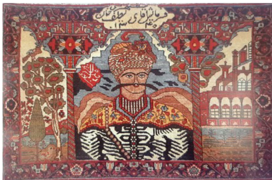
تصویر ۱. قالیچه تصویری شاه عباس، بختیاری (سامان)، ۱۳۴۰ هجری قمری (تناولی، ۱۳۶۸: ۲۵)

تصویر انسان در قالی‌های دوره قاجار، از لحاظ موضوعی بسیار متنوع است؛ در موضوعات گوناگون تصویر شده در قالی‌های تصویری این دوره، در چهار دسته قابل طبقه‌بندی است؛ دسته اول با عنوان قالی‌های سلاطین یا مشاهیر معروف است که در آن‌ها تصاویر افراد مختلف اعم از افراد مشهور یا پادشاهان دوره‌های مختلف تاریخی در کنار هم آمده است. در این قالی‌ها صورت و نام پادشاهان از دوران اساطیری ایران و سپس دوران تاریخی اشکانی، ساسانی، صفوی، افشار، زند و قاجار تا دوره احمدشاه بر روی قالی نقش بسته است (تصویر ۱). دسته دوم، قالی‌هایی با موضوعات ادبی که برگرفته از داستان‌های هفت‌پیکر یا شاهنامه هستند و شخصیت‌ها و افرادی از این داستان‌ها در اندازه و ابعاد قابل توجه به تصویر درآمده‌اند (تصویر ۶). دسته سوم، قالی‌هایی هستند که مضامین مذهبی دارند و عموماً شخصیت‌هایی همچون