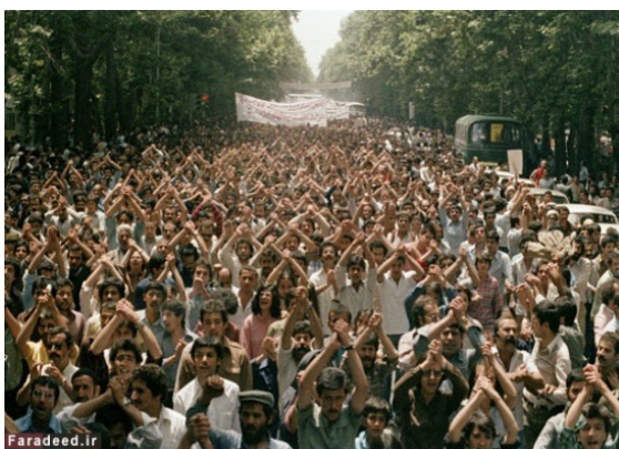
تصویر ۹. اکبر ناظمی، راهپیمایی اربعین، انقلاب ۵۷. /https://faradeed.ir

اکبر ناظمی از جمله عکاسانی که در روزهای انقلاب به صورت رنگی عکسی می‌کرد، ثبت‌های بسیاری را از خود به جای گذاشته است. عکس مربوط به تصویر ۹ نمونه‌ای از عکس‌های ایشان از راهپیمایی بزرگ اربعین است. عکس، جمعیتی نامتناهی را نشان می‌دهد که به معنای همبستگی، دست‌ها را بالای سر خود گره کرده‌اند. این تصویر که دارای پرسپکتیو تک نقطه‌ایست جمعیتی نامتناهی را برای بیننده القا می‌کند. گویی هر چه چشم آدمی به سمت عمق این تصویر حرکت کند باز هم پایانی برای آن نمی‌یابد. زاویه عکاس و نوع کادربندی ایشان تاکیدی بیشتر بر فرم دست‌ها دارد. داستانی که اینگونه بالارفته نشانه‌ای از استحکام ملت و نیز همبستگی میان آنان است. تصویر ۱۰ از مریم زندی که مانند بسیاری از عکس‌ها از نمای بالا گرفته شده، نوشته‌ای به زبان انگلیسی در آن به خوبی قابل مشاهده است. در این نوشته آورده شده است که «ما به یانکی ۳ برای اداره کشور نیازی نداریم. ما برای جابگزینی آمریکایی‌ها آموزش دیده‌ایم.» این نوشتار نشان می‌دهد که مردم به دنبال آزادی هستند و شاه را عاملی از عوامل آمریکایی و یا به بیانی دیگر سرباز آمریکایی می‌دانند. آنان خواهان آن هستند که خود کشورشان را اداره کرده و از زیر سلطه آمریکایی‌ها رهایی یابند. این نوع پیام‌ها در پلاکاردهای متعددی در آن روز به چشم می‌خورد. تصویر ۱۱ ثبت شده توسط حسین پرتوی از عکاسان روزنامه