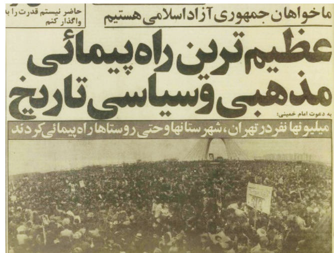
تصویر ۲. روزنامه کیهان، از چپ به راست صفحه ۶ و ۳، ۱۳۵۷ دی ۱۳۵۷.