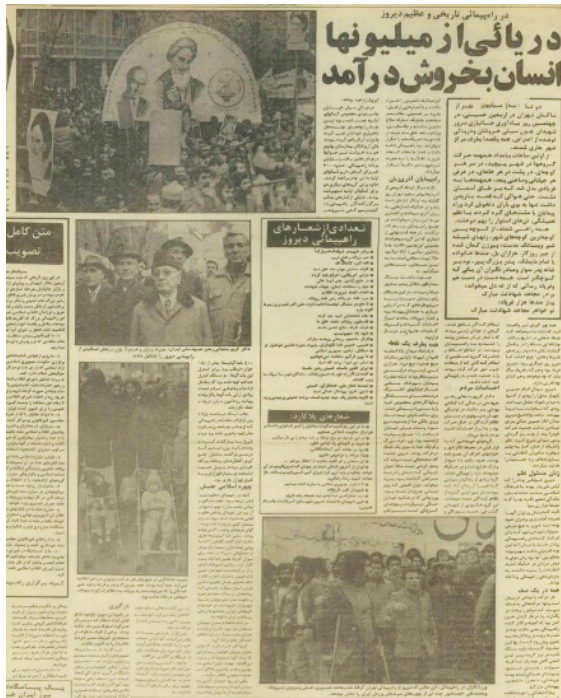
تصویر ۳. روزنامه کیهان، صفحه ۴۰، ۷ دی ۱۳۵۷.

عکس بعد نیز به حضور جوانان ورزشکاران مطرح در آن روزها اشاره دارد. حضور یک ورزشکار با اعضا در قسمت جلوی عکس احساسی از همتی استوار را تحت هر شرایطی برای بیننده بازنمایی می‌کند. (تصویر ۳)