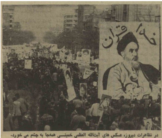
در تظاهرات نیرووز، عکس های آیت الله العظمی خمینی همجا به چشم می خورد.