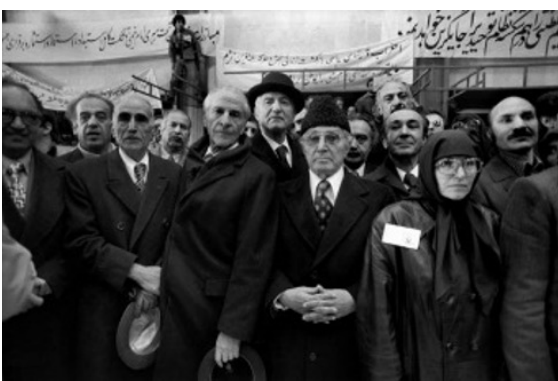
تصویر ۸. عباس عطار، راهپیمایی اربعین ۱۳۵۷.

تصویر ۸ نیز از افرادی که در این تظاهرات حضور داشته‌اند خبر می‌دهد. این افراد از رهبران حزب‌های فعال در زمان انقلاب هستند که حالا همگی ایشان با مردم هم صدا شده‌اند. حضور این افراد را می‌توان نمادی از حضور افراد فرهیخته و مبارز قلمداد کرد.