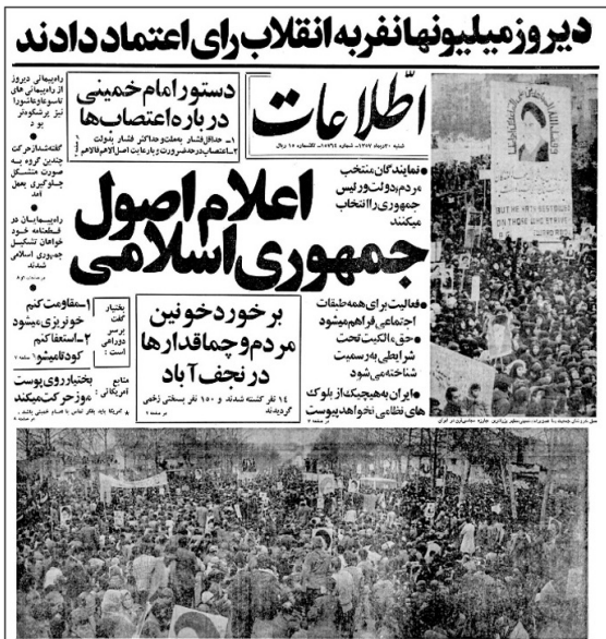
تصویر ۱. روزنامه اطلاعات، صفحه ۱۳، ۱۳۵۷ دی ۱۳۵۷.

از روزنامه‌های مطرحی که می‌توان در آن روزها نام برد، سه روزنامه اطلاعات، کیهان و آیندگان است. از آنجا که روزنامه مهمترین مطبوعات در اختیار مردم بود و بعد از اعتصابی دو ماهه هر گونه سانسور را در خود کنار گذاشت، مردم نیز برای کسب اطلاعات و اخبار روز به این نوع رسانه رجوع می‌کردند. به همین دلیل روزنامه‌ها در روزگار انقلاب جزو مهمترین رسانه‌ها به شمار می‌رفت که گویی با خود مردم هم صدا شده بود. روزنامه اطلاعات در صفحه نخست خود (تصویر ۱) دو عکس از جمعیت راهپیمایان منتشر می‌کند و حضور ملت را رای اعتمادی به انقلاب می‌شمارد. در عکس عمودی، پلاکاردی بزرگ از امام خمینی است که در آن نوشته ای مربوط به آیه مجاهدین است و این نوشته را به سه زبان بر روی پلاکارد آورده‌اند. آیه «وَقَضَىٰ اللَّهُ الْمُجَاهِدِينَ عَلَى الْقَاعِدِينَ أَجْرًا عَظِيمًا» اشاره به پاداشی عظیم برای کسانی که در راه خدا مجاهده کرده اند دارد و آنان را با کسانی که بر سر جای خود نشسته و کاری نمی‌کنند، مقایسه می‌کند. ترجمه آیه به زبان فارسی و نیز انگلیسی در ذیل آن آورده شده است.