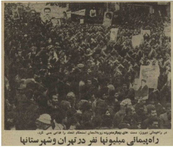
در راهپیمایی نیرووز، دست های بهگرمشورده روزه آسمان استحکام اتحاد را هائی می کرد. راهپیمایی میلیونها نفر در تهران و شهرستانها