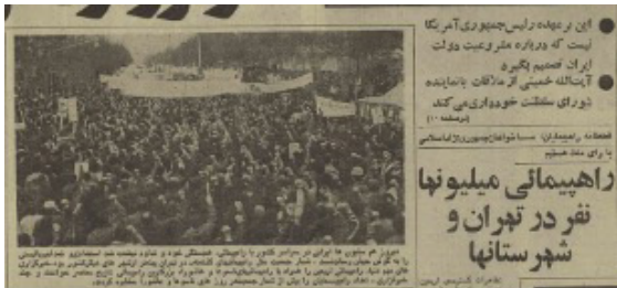
تصویر ۴. روزنامه آیندگان، صفحه ۱ و ۲، ۳۰ دی ۱۳۵۷.