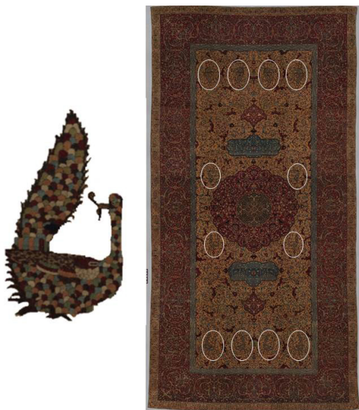
تصویر ۲. جانمایی دوازده طاووس در کنارهای بالایی، پایینی و پیرامون ترنج

از منظر واژگانی «طاووس در لغت اسم پرنده ایست بزرگ قشنگ و دارای رنگ‌های متعدد و تاج و نر آن دارای دوم عریض و طویل است که گاهی آن را بلند و باز کرده رقص می‌کند» (داعی‌الاسلام، ۱۳۶۳: ۶۳۲). نقش‌مایه طاووس جدا از محل قرارگیری در متن، معانی گوناگونی دارد. مفاهیم در دودسته مثبت و منفی قابل طبقه‌بندی هستند: زیبایی در دسته نخست و غرور، شهوت، تجمل و تصنع در دسته دوم جای می‌گیرند. محمدجعفر یاحقی در مورد این پرنده می‌نویسد: نَسَفی به هنگام بیان و تعبیرات عرفانی - فلسفی خویش از داستان آدم و حوا در میان کسانی که