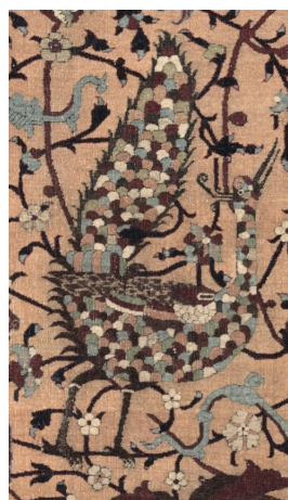
تصویر ۱۰-الف (سمت راست). طاووس‌های کوچک‌تر اطراف ترنج قالی آنهالت