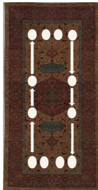
تصویر ۱۱. حفظ تقارن در میان نقوش جانوری (طاووس) با چیدمان خطی در بالا و پایین قالی از طاووس‌های بزرگ‌تر و چهار طاووس کوچک‌تر با جانمایی مدور گردترنج

- علاوه بر ایجاد تنوع با افزودن مستوره رنگی به نقش طاووس که موجب تنوع شده است، از سویی دیگر گردش چشم مخاطب در سطح