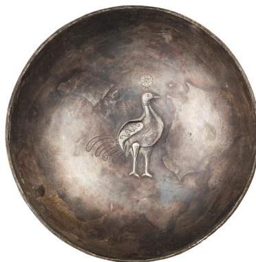
تصویر ۳-الف (راست). بشقاب سیمین ساسانی، مجموعه بونامز، منبع: (URL2)