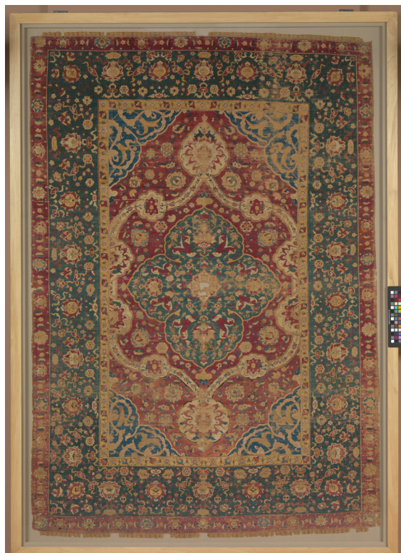
تصویر ۸. جدول رنگی (مستوره) در کنار قالی کاشان، عصر صفویه، محفوظ در موزه متروپولیتن

دادی تو پر خویش و دو سه دانه خریدی / چون گرسنه قحط در این لقمه فتادی / که لب بگزیدی و گهی دست خلیدی (مولانا، ۱۳۸۸: ۸۲۰) طاووس در شعر مولوی گاهی نیز نمادی از علمای ظاهری است. «طاووس در عرفان مولانا از علمای ظاهر و ققه‌های قشری به طاووسان پُران و از فقیه عالم و عالم کامل ظاهری که به کمال واقع نرسیده به طاووس علین یا طاووس باغ بهشت تعبیر می‌کند» (یاحقی، ۱۳۷۵: ۲۹۳). در این باره بی‌بی از اشعار سعدی نیز مرتبط است: