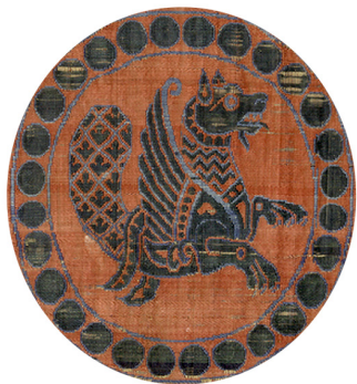
تصویر ۲-ب (چپ). پارچه ساسانی، دم طاووس در طراحی سیمرغ

در فرهنگ و ادبیات مسلمانان طاووس معانی متفاوتی دارد. بنا بر بعضی روایات، پیامبر اسلام به هنگام معراج بر موجودی سوار بوده به نام بُراق که بدن اسب، سر انسان و دم طاووس داشته است. (تصویر ۴-۵) لازم به توضیح است که اضافه شدن دم طاووسی به ترکیب بُراق، از دوره قاجار در هنر ایران نمودار شد. «به‌واسطه پررنگ شدن اعتقادات مذهبی مانند بهشتی بودن طاووس از دوره صفوی به بعد و تصویرگری طاووس