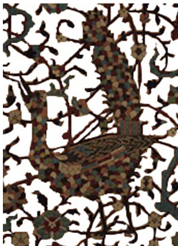
تصویر ۱۲. نقش جانوری (طاووس) در نقوش گیاهی.

قالی با همسانی و هماهنگی رنگ‌های زمینه و نقوش (دوازده طاووس) تسهیل شده است و دچار ایستایی نمی‌شود (تصویر ۱۱). کندوکاو بعد معناشناختی طاووس در دو محور قابل مطالعه است: نخست نمادشناسی عدد (تعداد طاووس‌ها). عدد دوازده با تفکر شیعی دوازده‌امامی صفویه در ارتباط بوده و به‌طور ضمنی بر استحکام تفکر و جریان شیعی نزد ایشان دلالت دارد (تصویر ۲). دوم نمادشناسی نقش (طاووس). ارتباط طاووس با بهشت، دلالت‌گری نقش بر جایگاه ائمه اطهار (ع) و حضرت مهدی (عج) طاووس را به نشانی شیعی نزد هنرمند صفویه بدل نموده است (جدول ۱).