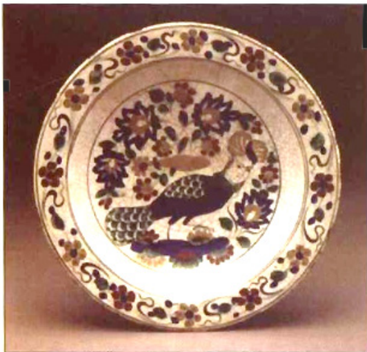
تصویر ۷. ترکیب انسان و طاووس، دوره صفوی، محفوظ در موزه سین سینتاتی، منبع: (محمد پناه، ۱۳۸۹: ۱۴۴)

فرم و ترکیب نگاره درخت و پرنده در هنر ایرانی از منظر مفهوم و محتوا نیز طبقه‌بندی شده است: «اگر تصویر درخت شیوه یافته و مرغ شناختنی را در نخستین آثار قرن یازدهم قمری به یادآوریم، در آغاز، آثار «درخت و مرغ» به وجود آمده‌اند و پس از آن‌ها «گل و بلبل» و در زمان