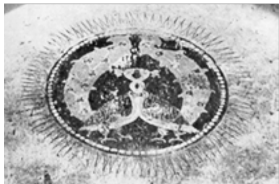
تصویر ۶. نقش دو طاووس، برج‌های دو گانه خرقان، عصر سلجوقی، منبع: (خزایی، ۱۳۸۶: ۷)