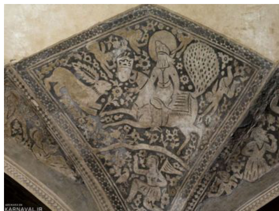
تصویر ۴. معراج حضرت پیامبر (ص)، براق با دم طاووس، آهک‌بری حمام و کیل، زندیه