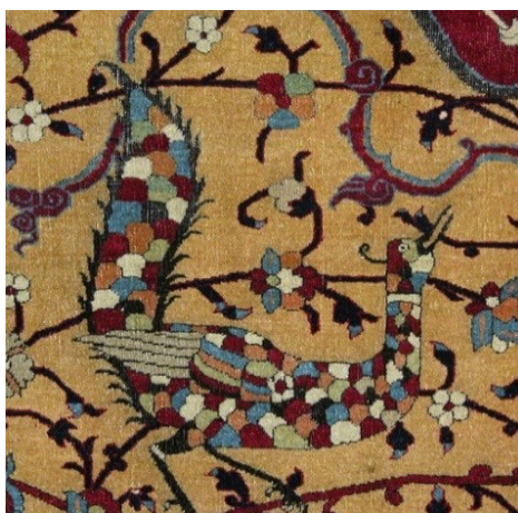
تصویر ۱۰-ب (سمت چپ). طاووس‌های بزرگ‌تر در اضلاع بالا و پایین زمینه قالی

در رویارویی دو گفتمان میان صفویان شیعه و عثمانیان اهل تسنن، هر یک در پی اثبات حقانیت و مشروعیت بخشی به تفکرات و پایه‌های حکومتی خویش بودند؛ از این میان آثار هنری و تولیدات فرهنگی به‌عنوان بستری گویا با اثرگذاری ماندگار از اهمیت بسزایی برخوردار بودند: «هنرمند صفوی با استفاده از نماد طاووس بر سر در اماکن مذهبی به شکلی آگاهانه یا ناآگاهانه، پلی ارتباطی میان دو نوع متفاوت تفکر اسلام شیعی و باورهای پیش از آن به وجود آورده است که باگذشت چهار قرن، هنوز به شکلی فراگیر به وظیفه اصلی خود یعنی انتقال مفاهیم عمیق مذهب شیعه در کنار توجه به تمامی تعبیری که پیرامون این نماد وجود داشته است، عمل نماید و جلوه‌ای ملی- مذهبی در اثر ایجاد می‌کند» (خان حسین‌آبادی، ۱۴۰۰: ۱۸). بر همین اساس پیام مشروعیت حکومت صفوی نیز مخابره می‌شده است: «بنابراین، بر طبق اصل شیعه دوازده‌امامی آنچه مشروعیت فرمانروا را تعیین می‌کند، آن است که از سوی سلفی برحق (نص) منصوب شده باشد و اصل و نسب او تأثیری در مشروعیتش ندارد» (جکسون و لاکهارت، ۱۳۹۰: ۱۹۷). در مجموع «مفاهیم نمادین طاووس در تزئینات سایر اماکن مذهبی در عهد صفوی و بعد از آن می‌تواند بدین شرح باشد: ۱. حضرت مهدی (عج) و مبحث امام شناسی در باور شیعه ۲. بیانگر ارزش توسل و شناخت امامان برای ورود به بهشت» (خان حسین‌آبادی، ۱۴۰۰: ۱۸). بنابراین نقش طاووس در دوره صفویه نشانه‌ای دال بر تقویت تفکر و جریان شیعی لحاظ گردیده و برای