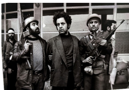
تصویر ۶. دستگیری ساواک.