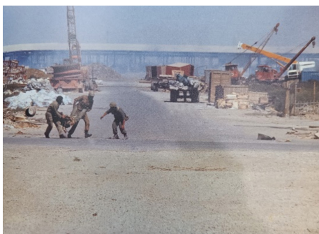
تصویر ۲۳. دفاع نیروهای مدافع (بی‌نا، ۱۳۸۷: ۲۸۵)