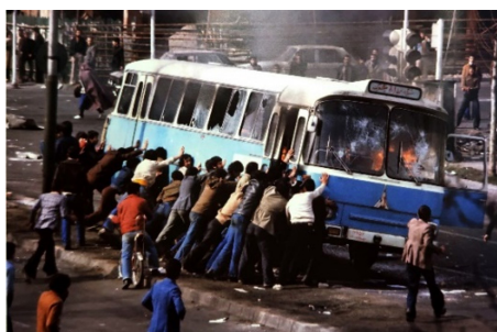
تصویر ۷. تلاش مردم برای خاموش کردن آتش. منبع: (ستیون، ۱۳۹۵:۱۷۵)