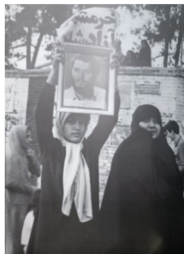
تصویر ۱۸. شادمانی مردم (بی‌نا، ۱۳۸۷: ۱۵۸)