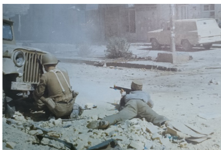
تصویر ۲۲. دفاع نیروهای مدافع (بی‌نا، ۱۳۸۷: ۹۸)