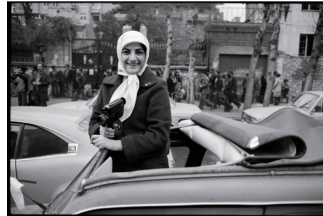
تصویر ۱۰. خلاصه خیابان‌های تهران پر از شادی است.