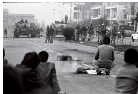
تصویر ۱۲. درگیری حکومت نظامی و تظاهر کنندگان.