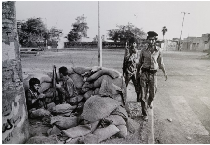
تصویر ۱۳. رزمندگان که خودشان سنگر ساختند و از شهر دفاع کردند (صادقی، ۱۳۹۵: ۲۴)