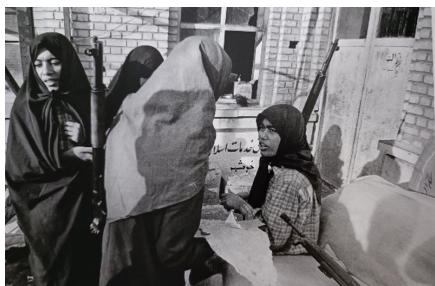
تصویر ۱۴. چند تن از دختران در کنار مدافعان شهر برای امداد رسان و مجروحان مانده‌اند (صادقی، ۱۳۹۵: ۲۳)