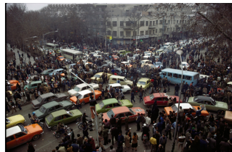
تصویر ۱۱. ترافیک.