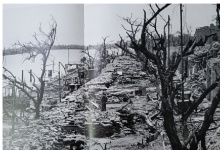
تصویر ۱۶. حاشیه رود کارون (صادقی، ۱۳۹۵: ۶۳-۶۲)