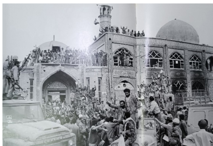
تصویر ۱۵. رزمندگان در مقابل مسجد جامع (صادقی، ۱۳۹۵: ۶۱-۶۰)