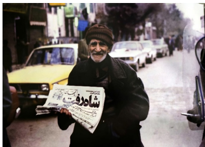
تصویر ۲. شاه‌رفت.