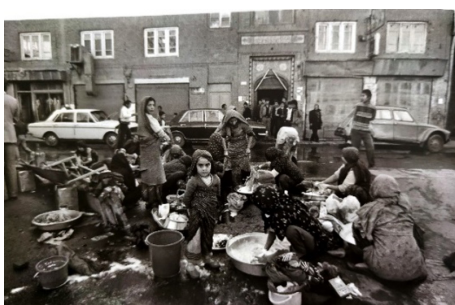
تصویر ۸. عدم وجود آب در خانه‌ها.