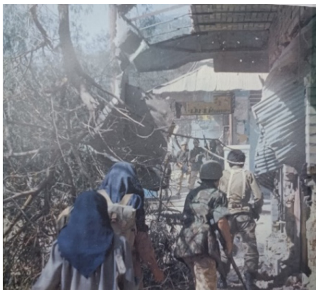
تصویر ۲۱. رزمندگان و نیروهای مردمی (بی‌نا، ۱۳۸۷: ۹۱)

همواره در شکل‌گیری انقلاب‌ها و جنگ‌ها شرایط جامعه بسیار نابسامان است. شرایط کشور ایران نیز در زمان انقلاب و جنگ تحمیلی از این قاعده مستثنا نبوده است. تمامی رویکردهای شش‌گانه عنوان‌شده در این پژوهش در مورد آثار به‌جامانده از این دوره از تاریخ ایران نیز قابل‌تأمل و بحث‌برانگیز هستند و می‌توانند تجربه ارزشمندی را برای عکاسان و هنرمندان برجای‌گذارده باشند. عکاسی خیابانی در این دوره از تاریخ ایران از جایگاه ویژه‌ای برخوردار بوده که در این پژوهش به