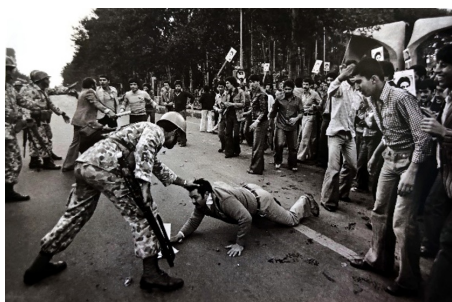
تصویر ۵. تجمع مردم در مقابل دانشگاه تهران و درگیری. منبع: (ستیون، ۱۳۹۵:۸۷)

می‌شل ستیون: عکاس نامدار فرانسوی در پاریس ساکن است. وی به‌واسطه ارتباط دوستانه با اطرافیان امام در همه مراسم و رویدادهای مختلفی که امام خمینی حضور داشتند دعوت می‌شد و از امام عکاسی می‌کرد. معروف‌ترین عکس وی از امام در زیر درخت سیب در نوفل‌لوشاتو بود. وی همراه امام به ایران آمد و وابسته به هیچ نشریه داخلی و خارجی نبود. مجموعه عکس‌های وی از انقلاب اسلامی ۳۷۰ قطعه است که در کتاب روزهای انقلاب به چاپ رسیده و بسیاری از