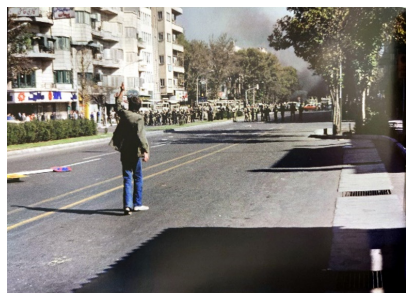
تصویر ۳. خیابان شاه‌رضا (انقلاب) بین صبا و چهارراه ولی‌عصر.

(علی‌حسینی و نصر اصفهانی، ۱۳۹۲: ۱۴۵). از جمله مهم‌ترین اسنادی که می‌توان بر اساس آن، واکنش‌های مختلف را ارزیابی کرد، قطعات عکاسی شده از وقایع انقلاب اسلامی ایران است. این آثار علاوه بر ارائه تصویری دقیق از وضعیت آن دوران، جهت شناسایی ژانرهای عکاسی خیابانی در تاریخ معاصر عکاسی ایران حائز اهمیت فراوان هستند.