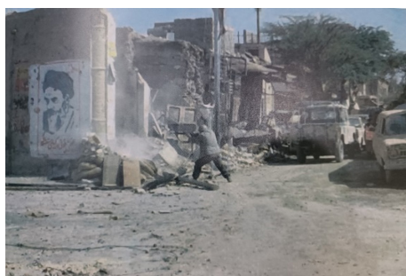
تصویر ۲۴. دفاع نیروهای مدافع (بی‌نا، ۱۳۸۷: ۹۸)