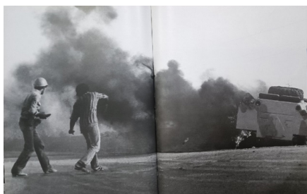
تصویر ۱۷. واپسین مقاومت‌ها قبل از سقوط خرمشهر (بی‌نا، ۱۳۸۷: ۲۸۷-۲۸۶)

خرمشهر به‌عنوان مرکز جنگ تحمیلی ایران مورد توجه این پژوهش قرار گرفته‌اند.