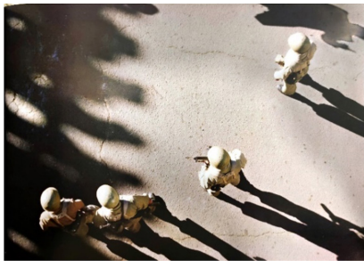
تصویر ۱. تجمع مردم در مقابل عوامل حکومت نظامی.