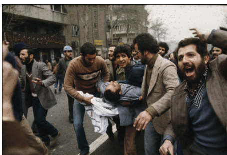
تصویر ۹. تظاهر کنندگان مجروح به آمبولانس منتقل می‌شوند.