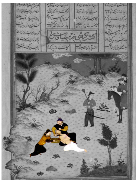
تصویر ۶- نگاره کشته شدن سیاوش، شاهنامه محمد جوکی، ۸۴۸ ه.ق، مکتب هرات. (با تمرکز بر پیکره‌ها)