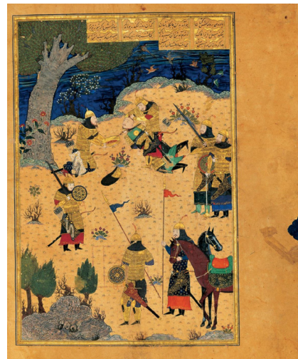
تصویر ۲- نگاره کشته شدن سیاوش، شاهنامه بایسنغری، ۸۳۳ ه.ق، مکتب هرات.