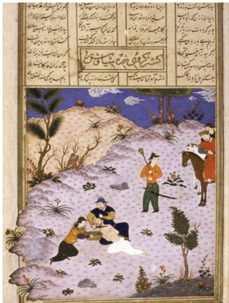
تصویر ۳- نگاره کشته شدن سیاوش، شاهنامه محمد جو کی، ۸۴۸ ه.ق، مکتب هرات. منبع: (توانا، ۱۳۹۷: ۱۲)

عناصر بصری نگاره (تصویر شماره ۵) در یک ترکیب‌بندی شلوغ و مملو از جزئیات به گونه‌ای چیده شده‌اند که چشم مخاطب را به سمت سوژه اصلی هدایت می‌کنند. تمهید هنرمند نگارگر در جهت قرارگیری نیزه‌ها و شمشیرها و همین‌طور جهت نگاه پیکره‌ها کاملاً عیان است. اتفاق اصلی تقریباً در یک‌سوم بالای تصویر و در میانه کادر در حال وقوع است. مردانی به دور اتفاق اصلی صحنه به تماشا ایستاده‌اند. تمامی چهره‌ها ریش و سیل دارند. لباس متفاوت و فاخرتر فردی که در پایین کادر و سمت راست کنار اسب‌ها ایستاده او را از سایرین متمایز می‌کند.