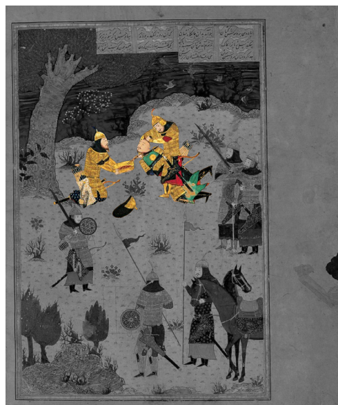
تصویر ۵- نگاره کشته شدن سیاوش، شاهنامه بایسنغری، ۸۳۳ ه.ق، مکتب هرات. (با تمرکز بر پیکره‌ها)