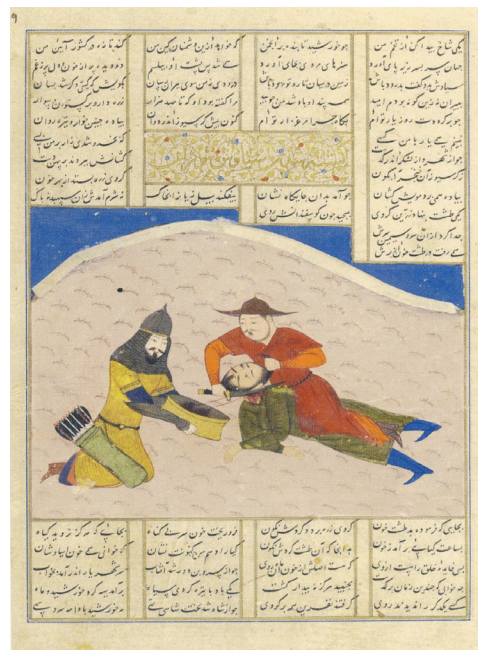
تصویر ۱- نگاره کشته شدن سیاوش، شاهنامه ابراهیم سلطان، دهه ۸۲۰ ه.ق، مکتب شیراز.

نگاره (تصویر شماره ۴) با گیاهان تزئینی هم‌سان پر شده. گروی بسیار بزرگ در میانه کادر و رو به پایین نقاشی شده‌اند. به استثناء پیکره‌های اصلی عنصر دیگری برای سردرگم کردن مخاطب وجود ندارد. قرارگیری