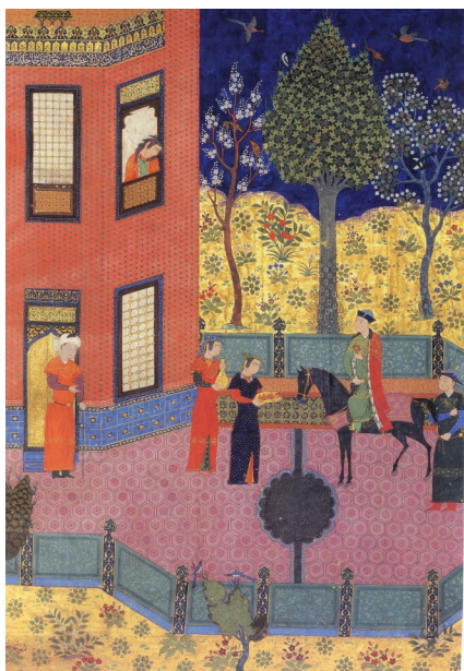
تصویر ۱: اردشیر و گلنار، مکتب هرات، کاخ موزه‌ی گلستان، نسخه‌ی چاپی ۱۳۵۰.

گلنار به ایوان خود می‌رود و از درون گنج‌ها، گوهرهای فراوان بر می‌دارد و روز بعد همراه با اردشیر به سمت پارس می‌گریزد، اردوان براشفته می‌شود و عده‌ای از جنگجویان را به دنبال آن‌ها می‌فرستد. در نهایت، اردشیر ابتدا بر فرزند اردوان، بهمن در پارس و سرانجام بر همه‌ی فرمانروایان اشکانی چیره می‌شود و سلسله‌ی ساسانی را بنیان می‌گذارد. اما در سراسر شاهنامه خبر دیگری از گلنار نمی‌یابیم.