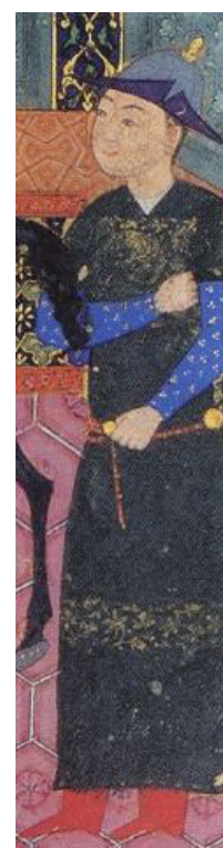
تصویر ۱۰، بخشی از نگاره‌ی اردشیر و گلنار منبع: (پاکباز، ۱۳۷۹: ۹۹).