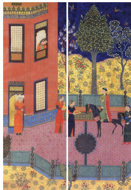
تصویر ۳، اردشیر و گلنار.