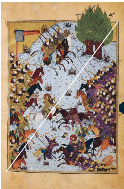
تصویر ۵، کشتن ارجاسب در روئین دژ.

نوع حرکت در این نگاره همانند نگاره‌ی "منذر شطرنج را در دربار انوشیروان می‌آموزد" که در (تصویر ۲) مشخص است به صورت ایستا است که از وقار و آرامش خاصی برخوردار است «غلبه‌ی نقوش معماری در طبیعت گرایی، استفاده از نقوش هندسی در آرایش بنا و توجه به جزئیات دیده می‌شود ولی هیچ گونه حرکت و پویایی در این نگاره‌ها مشاهده نمی‌شود و عناصر در حالت سکون قرار دارند» (نصیرآبادی، سالور، ۱۳۹۵: ۸۸). همچنین نگاره‌ی اردشیر و گلنار همانند اکثر نگاره‌های شاهنامه بایسنقری دارای ترکیب بندی نسبتاً متقارن و بیشتر متعادل و