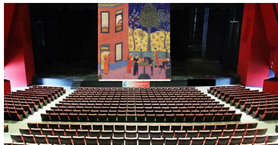
تصویر ۱۱، نمایی از سالن تئاتر شهر و نگاره‌ی اردشیر و گلنار.

یکی از موارد مهمی که به شناخت ساختار نمایشی یک تصویر کمک شایانی می‌نماید، بحث زاویه‌ی دید است. منظور از زاویه‌ی دید در اینجا، آن زاویه‌ی دید موجود در خود اثر نیست، بلکه مقصود، زاویه‌ی دید کلی تصویر است که تماشاگر با مخاطب با آن روبرو می‌شود. تصویر در نگاره‌ی اردشیر و گلنار اثر به گونه‌ای ترسیم شده است که گویی تماشاگران در سالن تئاتر نظاره‌گر آن هستند، زاویه‌ی ملایم از بالا به پایین دقیقاً یادآور جایگاه قرارگیری تماشاگران در یک سالن تئاتر است، (تصویر ۱۱). نکته‌ی مهم‌تر اینکه در این تصویر، صحنه به گونه‌ای ترسیم شده است که مخاطب از هر جایگاهی به راحتی می‌تواند همه‌ی اجزا و اشخاص صحنه را ببیند و هیچ عنصری، عنصر دیگری را ماسکه ۱۱ نکرده است، بنابراین اینگونه به ذهن متبادر می‌شود که تماشاگر می‌تواند از جای جای سالن، نظاره‌گر یک نمایش باشد. "حسین فدایی" در مقاله‌ی «تئاتر و مخاطب امروز کمی دقیق‌تر به این موضوع نگریسته و معتقد است «طرز قرار گرفتن تماشاگران در فضای تئاتری و رابطه‌ی آن‌ها با ناحیه‌ی بازی، در چگونگی دریافت اجرا، نقش اساسی دارد» (فدایی، ۱۳۸۸: ۱۶). بر این اساس به نظر می‌رسد زاویه‌ی دیدی که نگاره‌ی اردشیر و گلنار برای مخاطب ایجاد می‌کند، او را قادر می‌سازد که به طور همزمان به نقاط پیدا و پنهان موجود در صحنه اشراف داشته و نظاره‌گر وحدتی از