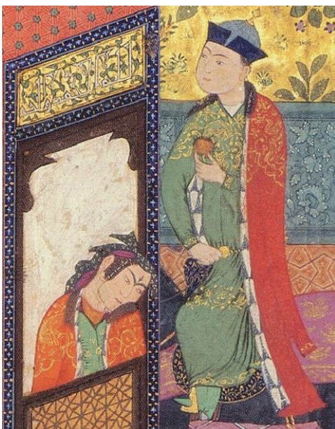
تصویر ۶، بخشی از نگاره‌ی اردشیر و گلنار