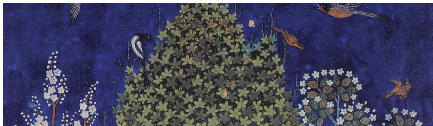
تصویر ۷، بخشی از نگاره‌ی اردشیر و گلنار منبع: (پاکباز، ۱۳۷۹: ۹۹).

متفکرین حوزه‌ی هنرهای نمایشی بر این باورند که حالت بدنی انسان در مواجهه با موقعیت‌های مختلف، نشان‌گر نوع تفکر او در آن موقعیت