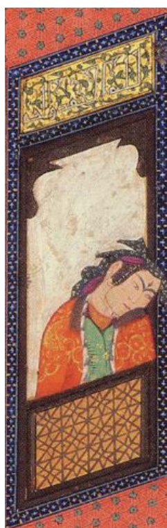
تصویر ۸، بخشی از نگاره‌ی اردشیر و گلنار، منبع: (پاکباز، ۱۳۷۹: ۹۹).