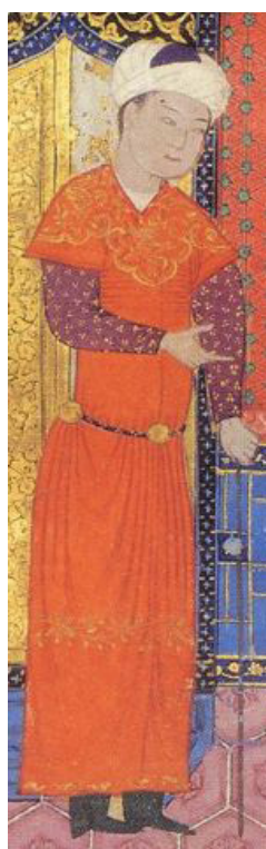
تصویر ۹، بخشی از نگاره‌ی اردشیر و گلنار منبع: (پاکباز، ۱۳۷۹: ۹۹).