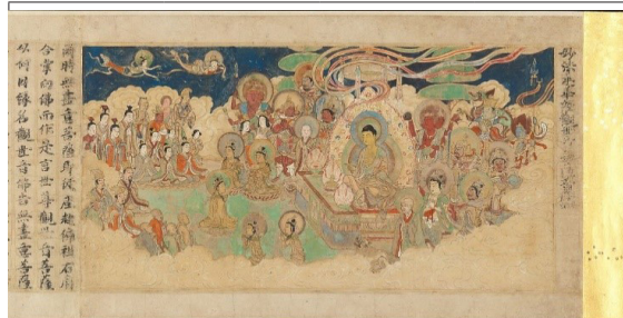
تصویر ۴. دروازه جهانی ادراک صداهاى جهان بودیساتوا، قرن ۱۲.