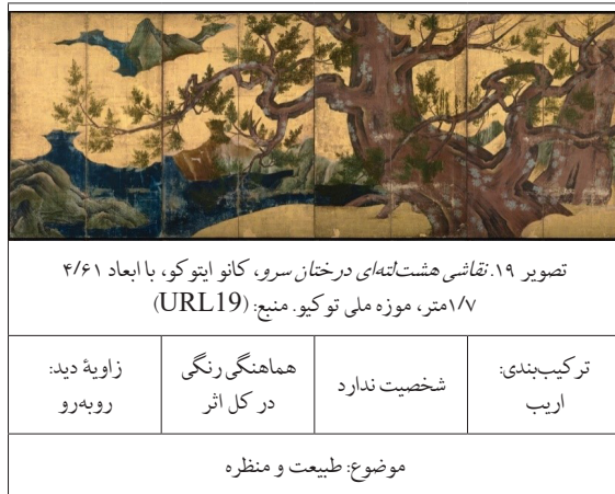
جدول ۱۳. نمونه ۴ دوره آشیکاگا.