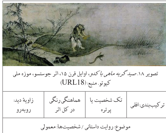
جدول ۱۲. نمونه ۳ دوره آشیکاگا.