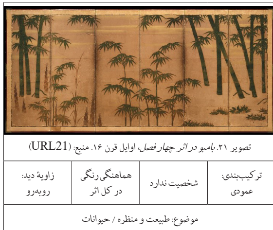
جدول ۱۵. نمونه ۶ دوره آشیکاگا.