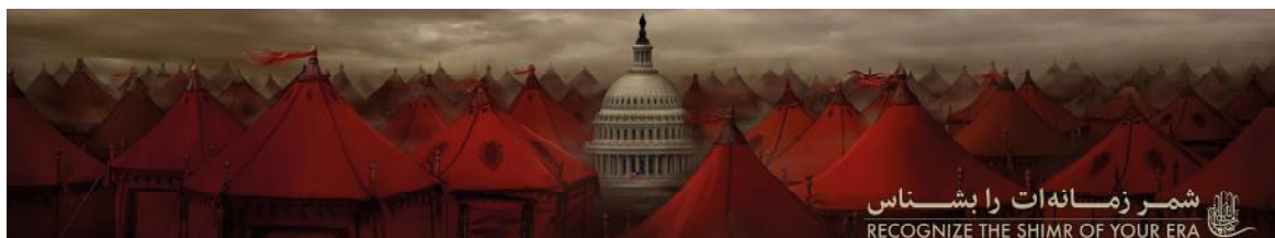
تصویر ۵. نقاشی دیجیتال دانیال فرخ با موضوع سپاه یزدیان.