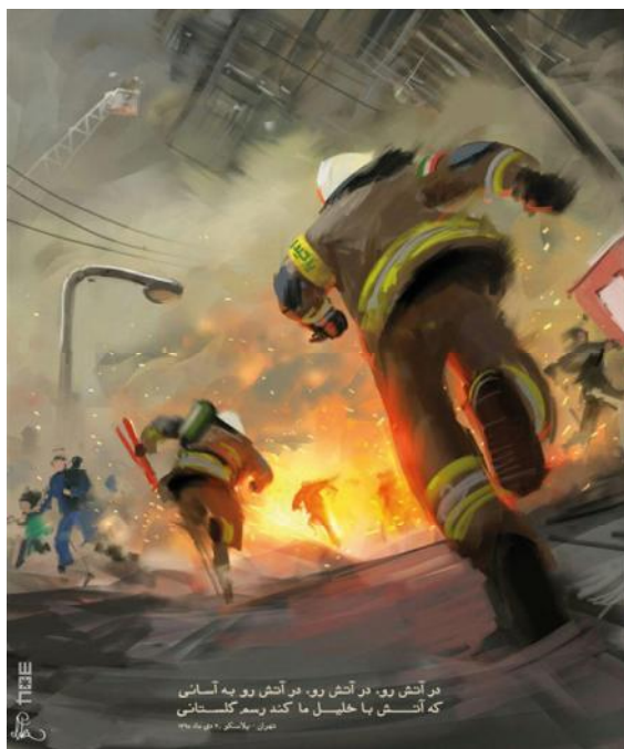
تصویر ۳. نقاشی میکائیل براتی با موضوع فداکاری قهرمانان آتش نشان.