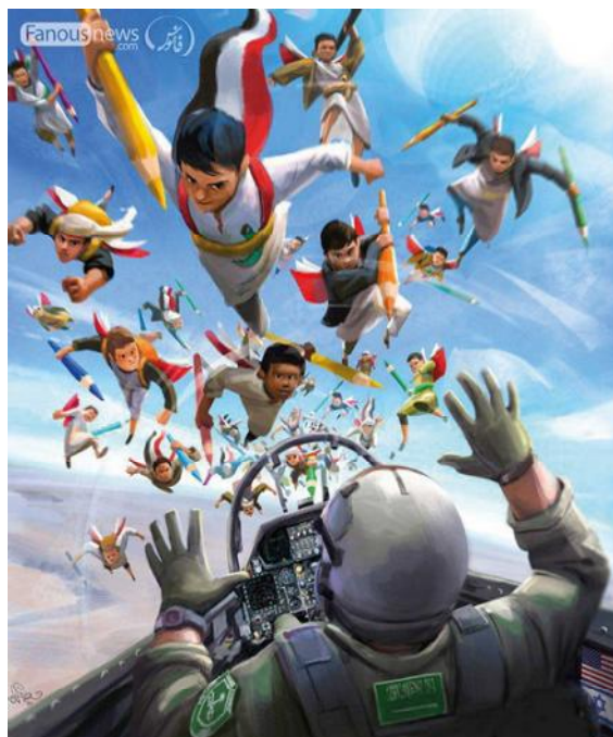
تصویر ۸. نقاشی میکائیل براتی با موضوع کبوتری در آسمان حرم.