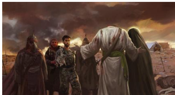
تصویر ۱. نقاشی دیجیتال حسن روح الامینی با موضوع شهادت شهید حججی. منبع: http://farhikhtegandaily.com/news/44292

نقاشی دیجیتال به جهت گستره امکانات فنی و ابزارهایی که به کاربر ارائه می کند و نیز سهولت کار با آن در نتیجه انعطاف بالا و هم چنین اختیار عمل فراوانی که با شبیه سازی قلم ها و تکنیک های مختلف نقاشی در آن فراهم آمده، می تواند حوزه فعالیت هنرمند را به صورت