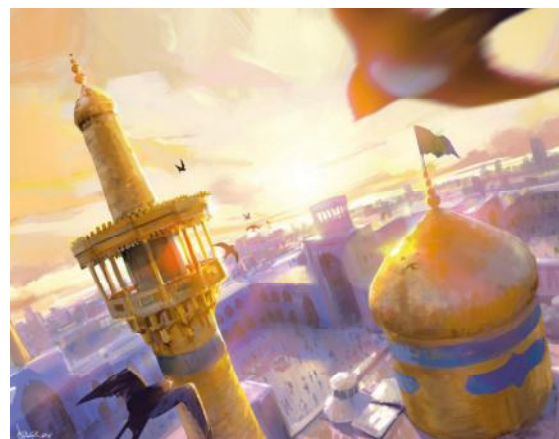
تصویر ۷. نقاشی میکائیل براتی با موضوع حمله جنگنده‌های سعودی به یمن.